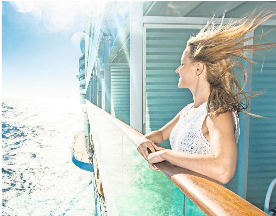
Wer im nächsten Jahr in den Urlaub starten will, kann sich auf der LN-Reisemesse informieren.