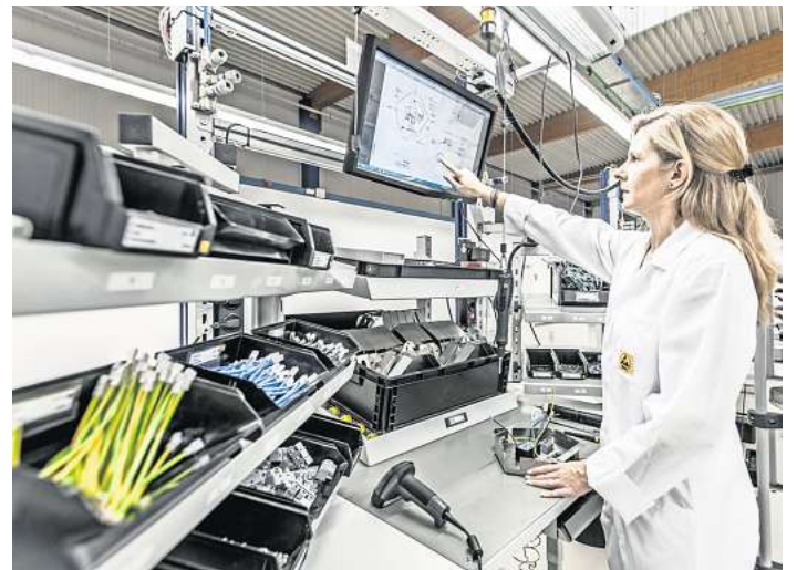
Fertigung von Geräten etwa für die Medizin- und Sicherheitsbranche.