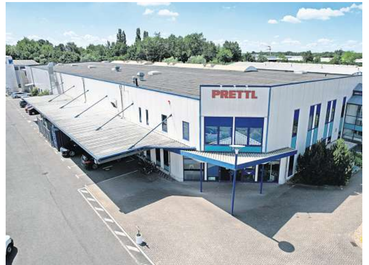
Prettl Electronics entwickelt, industrialisiert und fertigt elektronische Baugruppen.