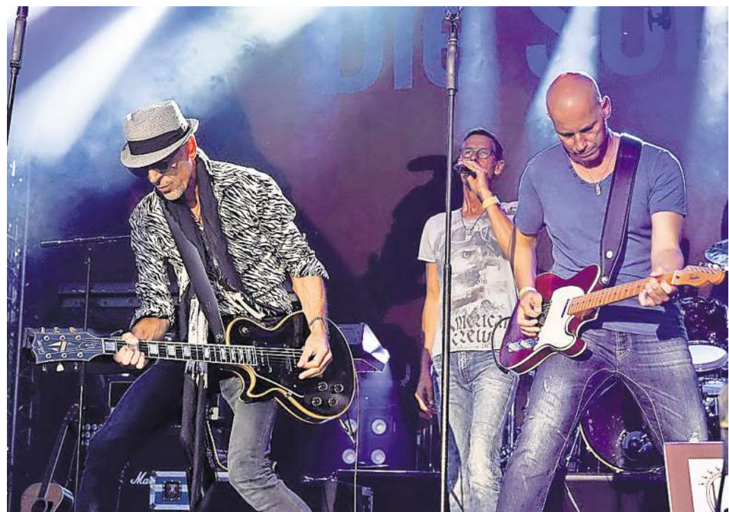
Tin Lizzy spielt heute Abend ab 19 Uhr auf dem Seebrückenvorplatz in Pelzerhaken.

Auch Familien kommen bei der Pfingstsause auf ihre Kosten. Neben den Konzerten ste-