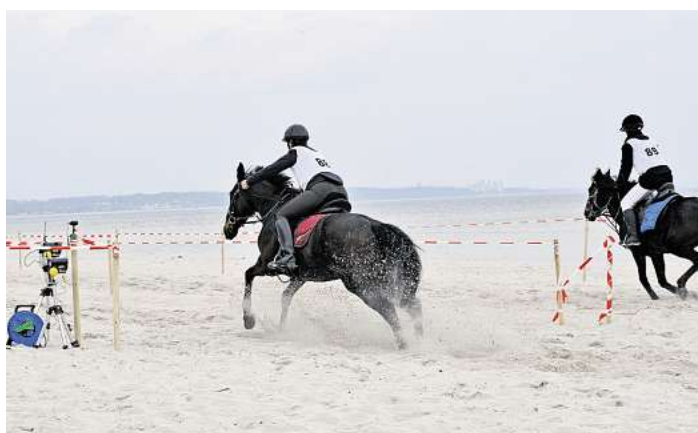
Über 100 Pferde und Ponys gehen beim Strandderby-Wochenende heute und morgen in Timmendorfer Strand an den Start.

An beiden Tagen sorgen Food-Stände und Aussteller im Strandpark sowie rund um den Seepferdchenbrunnen für entspanntes Bummeln, Schlemmen und Stöbern. Und am morgigen Sonntag, 8. März, heißt es zusätzlich von 12 bis 17 Uhr: verkaufsoffener Sonntag in Timmendorfer Strand – perfekt zum Shoppen zwischen den Rennen.