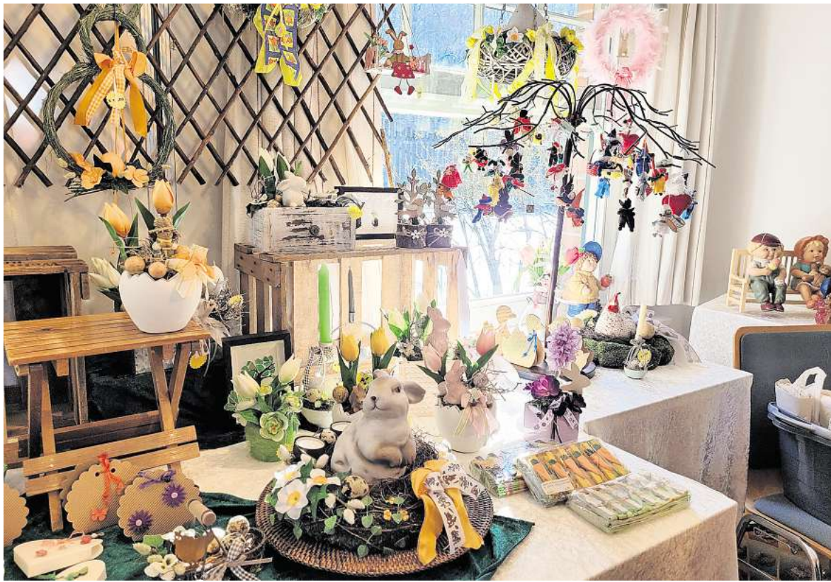
Osterzauber zum Mitnehmen: Farbenfrohe Eier, Hasen und Floristik bringen den Frühling von Klingberg direkt nach Hause.