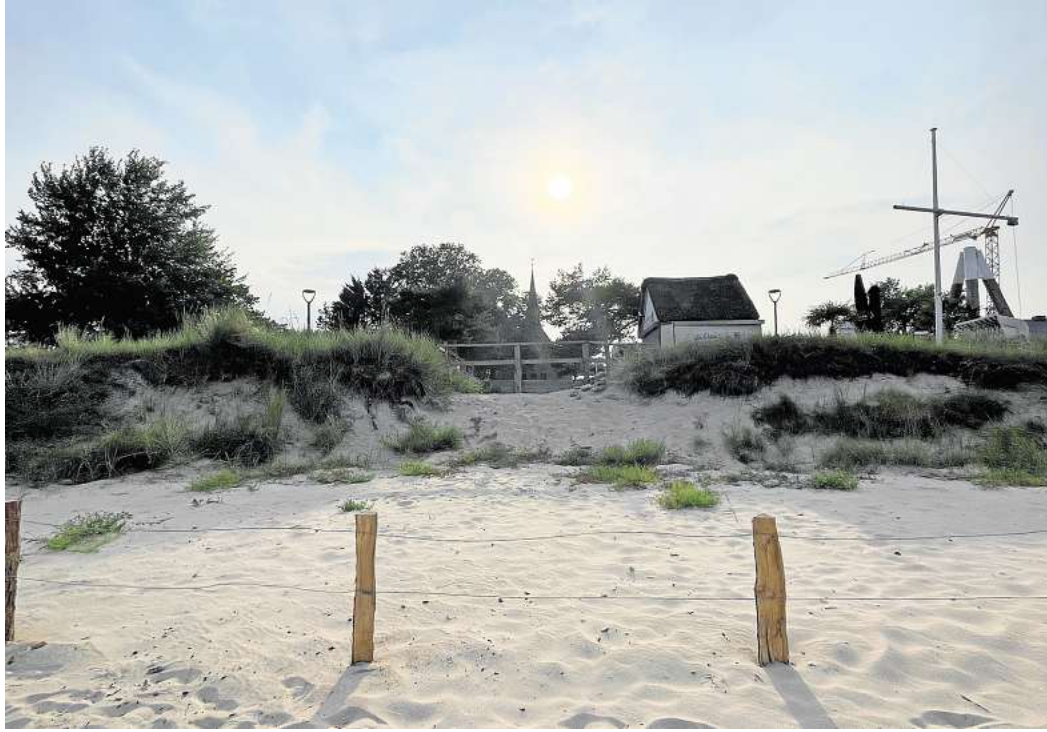
Das Sturmhochwasser im Oktober 2023 setzte der Strandarena, die direkt gegenüber der Strandkirche lag, heftig zu. Ihr ehemaliger Standort ist abgesperrt.

Insgesamt hat die Gemeinde Scharbeutz für die Beseitigung von Sturmschäden einen Reparaturbedarf von 657.040 Euro angemeldet. Aus dem Programm Soforthilfen Flutkatastrophe Ostsee erhält sie 492.780 Euro. Diese Förderung kann nicht weiter erhöht werden. Allerdings darf Scharbeutz nicht ausgeschöpfte Beträge für andere Reparaturarbeiten, beispielsweise für die Ausbesserung von Strandzufahrten und Ersatzpflanzungen in Dünen, mit den erhöhten Kosten