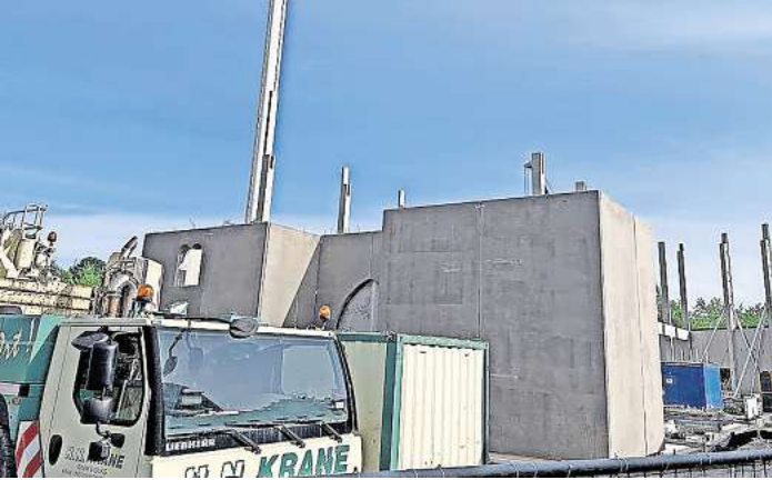
Der Neubau entsteht gerade und soll rund 40 mal 60 Meter groß und 16 Meter hoch werden.

Zudem ist eine Zeichnung zu sehen. Sie zeigt den ersten Wagen der Achterbahn. Dieser erinnert an eine Lokomotive mit