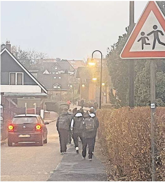
Vor der Emmi-Bonhoeffer-Schule wird es – wie an vielen anderen Standorten in Ostholstein – eng, wenn die Eltern morgens ihre Kinder mit dem Auto bringen.