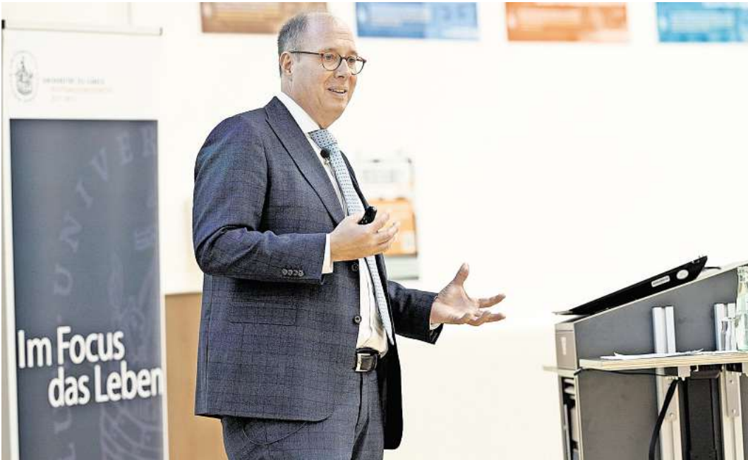
Helge Prof. Helge Braun wird sein Amt voraussichtlich im März antreten.

Das besondere Profil der Universität zu Lübeck bildet ein Themenspektrum ab, dem er sich als künftiger Präsident der Universität zu Lübeck widmen möchte. „Die Universität zu Lübeck hat in den letzten Jahren in Forschung, Lehre und Transfer mit begrenz-