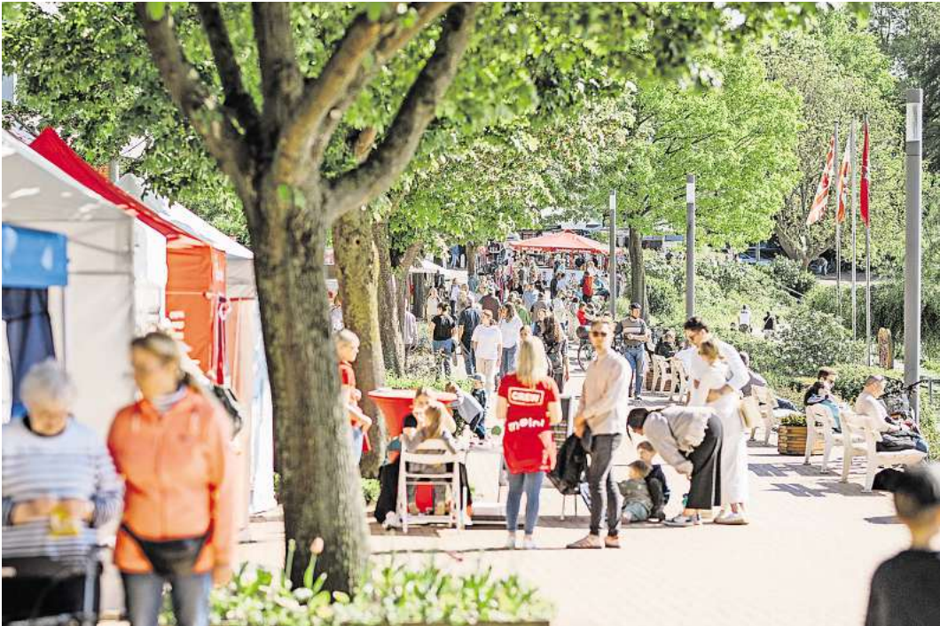
Lädt zum Stöbern ein: Der Malenter Landmarkt an der Diekseepromenade

Als besonderes Ereignis auf dem Landmarkt startet die Veranstaltung am Samstag, 14. September gegen ca. 10.15 Uhr mit der Versteigerung der alten Malenter Hinweisschilder und Fundfahrräder. Moderiert wird diese Aktion von Bürgermeister Heiko Godow. Der Erlös aus dem Verkauf der Schilder geht als Spende an die Kinder- und Jugendfeuerwehren der Gemeinde Malente.