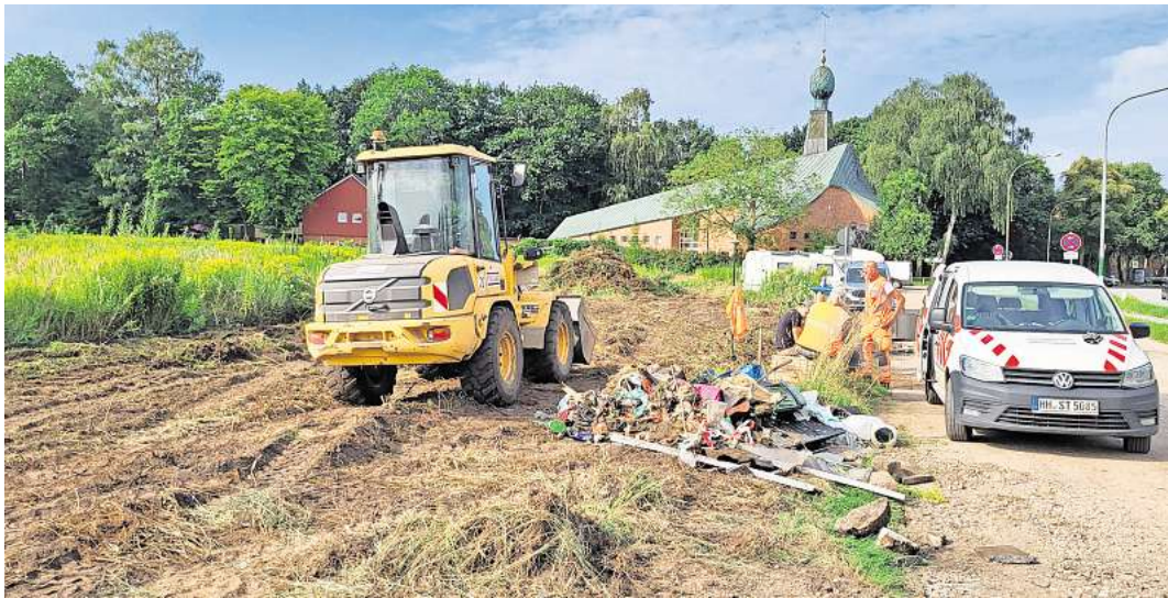
Die Erschließungsarbeiten für das neue Wohngebiet Lauerhofer Feld an der Schlutuper Straße haben begonnen.

Die Vermarktung der Geschosswohnungsbauten soll überwiegend über Bauträger erfolgen, erklärt die Liegenschaftsverwaltung. Für eine Baugemeinschaft aus mehreren privaten Bauherren wird es die Möglichkeit geben, eine Kombination aus einem Mehrfamilienhaus