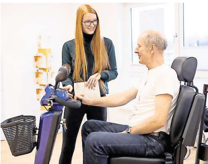
Kunden erhalten im Sanitätshaus Ostsee-Medizintechnik eine kompetente Beratung.