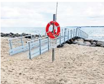
Der neue Steg bietet mehr Sicherheit für Hunde.

Senatorin Pia Steinrück, die an einigen Gesprächsrunden teilnahm, freute sich über die Fertigstellung des Steges und sagte: „Der Steg stellt eine willkommene Angebotsverbesserung für die Hunde haltenden Gäste aber auch für Bürgerinnen und Bürger Lübecks im Sinne der Steigerung der Tourismusakzeptanz, wie im Touristischem Entwicklungskon-