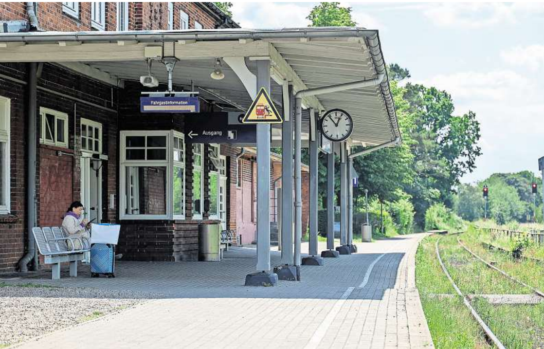
Der Bahnhof von Timmendorfer Strand: Ab 2029 kommt hier kein Zug mehr.

OSTHOLSTEIN. Das Aus der Bäderbahn schlägt hohe Wellen. Vor allem wirft die Deutsche Bahn mit ihrer Entscheidung, die Gleise betriebsbereit zu halten, viele Fragen auf. Wir beantworten sie. WAS IST DIE BÄDERBAHN? Die Zugverbindung führt von Lübeck aus über Bad Schwartau, Timmendorfer Strand, Scharbeutz, Haffkrug, Sierksdorf bis nach Neustadt. 1,4 Millionen Fahrgäste nutzten die Strecke laut dem Verkehrsverbund Nah.SH allein 2023. Die Direktverbindung wurde von der Deutschen Reichsbahn im Jahr 1928 fertiggestellt. Bis vor einem Jahr ging es von Neustadt über Lensahn, Großenbrode weiter bis nach Fehmarn. 2022 wurde die Verbindung aufgrund des Baustarts für die Hinterlandanbindung der Bahn gekappt.