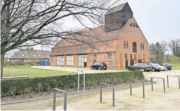
Turm weg, Gebäude sanieren, dahinter Apartments bauen – so sehen die Vorstellungen der Festspiele aus, die den Kuhstall kaufen wollen.