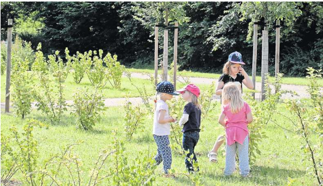
Im Küchengarten Schloss Eutin wird für Kinder ein Bewegungsspaß an frischer Luft angeboten.