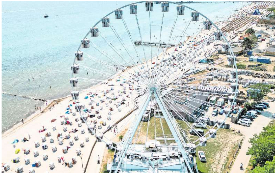
Der Sommer in Grömitz ist für die Betreiber des Riesenrads auch 2024 fest eingeplant.

NIENDORF. Zum Gemeindegottesdienst lädt Pastor Johannes Höpfner am 10. Januar ein. Es wird Bingo gespielt. Beginn ist um 15.30 Uhr im Gemeindeforum, Störtebekerweg 22b. Es gibt auch Kaffee und Kuchen.