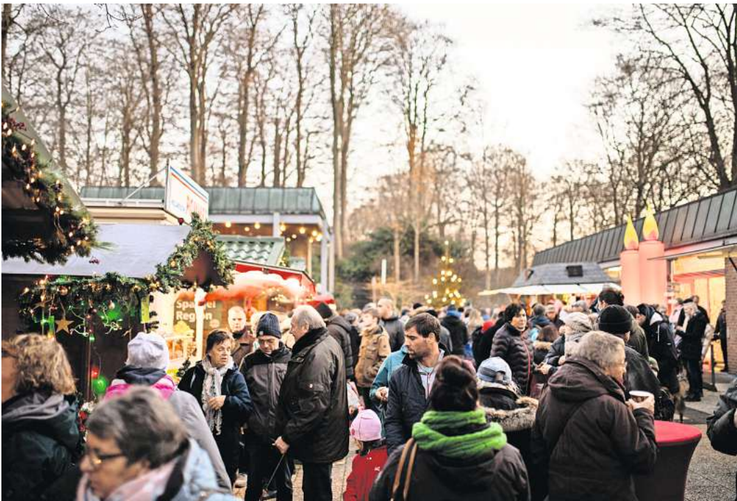
Für das Weihnachtsdorf in Malente können sich Aussteller jetzt bewerben.

Kraniche, der große Regen!“ Der Eintritt beträgt 30 Euro, für Jugendliche bis 18 Jahren Eintritt frei, für Studenten 15 Euro, für Mitglieder oder Kurgäste 25 Euro. Reservierungen unter info@weltklassik.de und Telefon 0151/ 125 855 27.