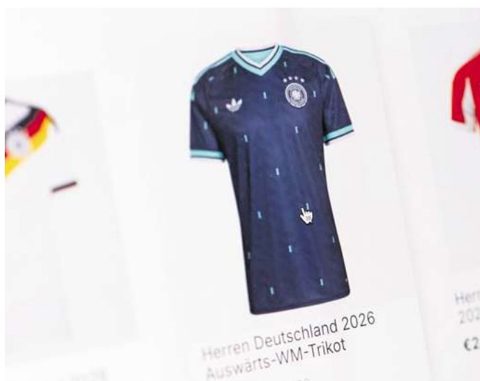
Die Suche nach günstigen WM-Trikots führt schnell zu unseriösen Onlineshops.

Auch bei schlechtem Wetter kann die Veranstaltung stattfinden: Bühne und Zuschauerbereiche sind überdacht. Der Brüggmanngarten liegt direkt an der Travemünder Strandpromenade, nur wenige Gehminuten vom Strandbahnhof entfernt.