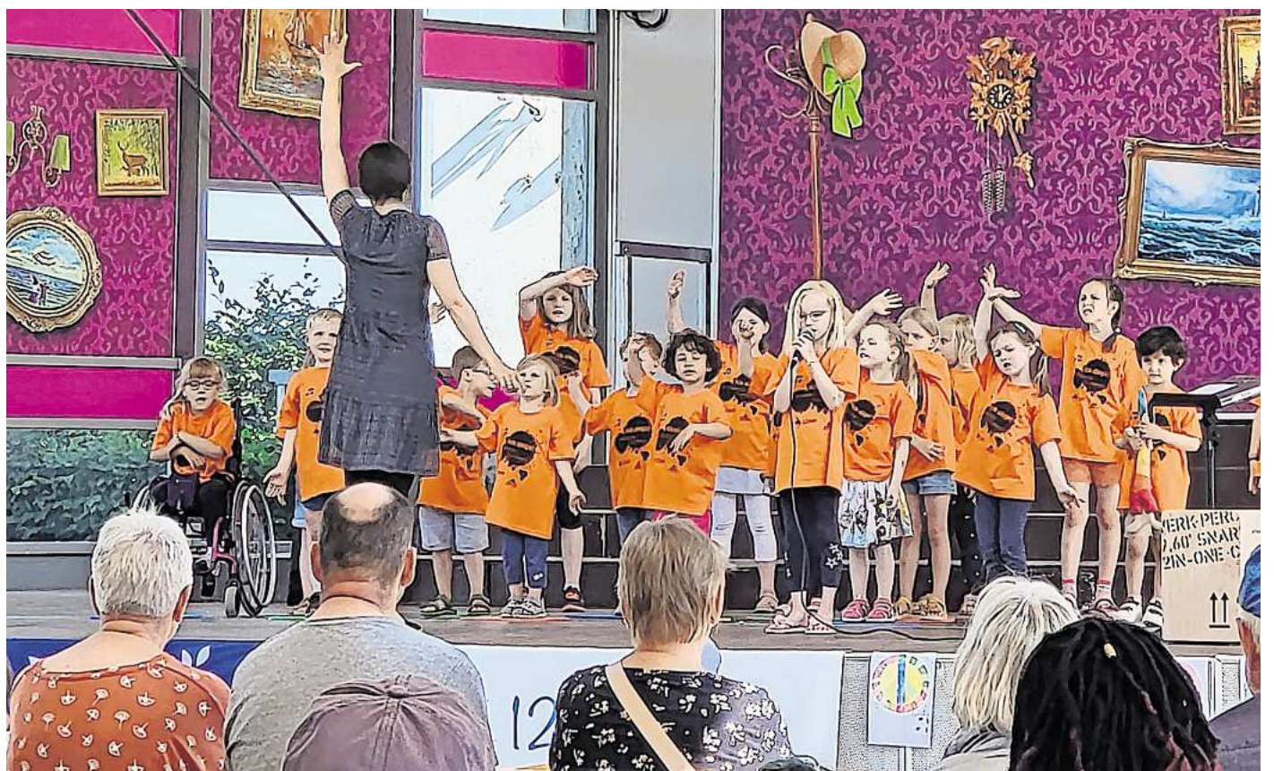
Beim Musik-Marathon der Travemünder Musikschule „123musik“ präsentieren rund 70 Kinder und Jugendliche heute ein abwechslungsreiches Programm zum Zuhören und Mitmachen.

Anders sieht es bei vielen Fake-shop-Seiten aus, die per Vorkasse abzocken und nie etwas verschicken. Sie machen sich erst einmal höchstens durch unglaublich günstige Preise verdächtig, sind aber sonst auch auf den zweiten Blick kaum als Fakeshop zu erkennen: Professionelle Gestaltung, viele Informationen, ein Impressum, allgemeine Geschäftsbedingungen und Kontaktangaben – alles gefälscht – geben zunächst keinen Anlass für Zweifel. Natürlich kann man den gefälschten Angaben – etwa im Impressum – durch Recherche im Netz auch selbst auf die Spur kommen. Schneller und bequemer geht es aber etwa mit dem Fake-shop-Finder der Verbraucherzentrale unter www.verbraucherzentrale.de/fake-shopfinder . Das KI-gestützte Tool analysiert Seiten anhand verschiedenster Faktoren und gibt dann eine Einschätzung ab, zum Beispiel „rotes Licht“, wenn es sich höchstwahrscheinlich um einen Fake-shop handelt.