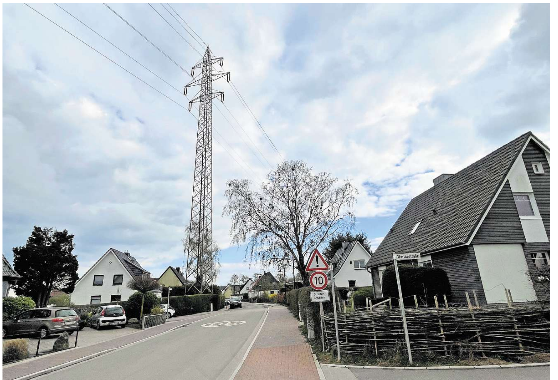
In Scharbeutz führt die alte Stromtrasse mitten durch ein Wohngebiet. Diese Masten werden entfernt.

Allein Rückenschmerzen haben laut Daten der AOK Nordwest 2025 im Kreis Ostholstein rund 56.600 Fehltag bei AOK-Versicherten verursacht. Etwa 61.300 Ostholsteiner befinden sich demnach wegen Rückenschmerzen in ärztlicher Behandlung, das entspricht rund 30 Prozent der Bevölkerung. Neben körperlichen Belastungen gelten auch Faktoren wie Stress, Depressionen, Bewegungsmangel, Rauchen oder Übergewicht als Risikofaktoren. HAD