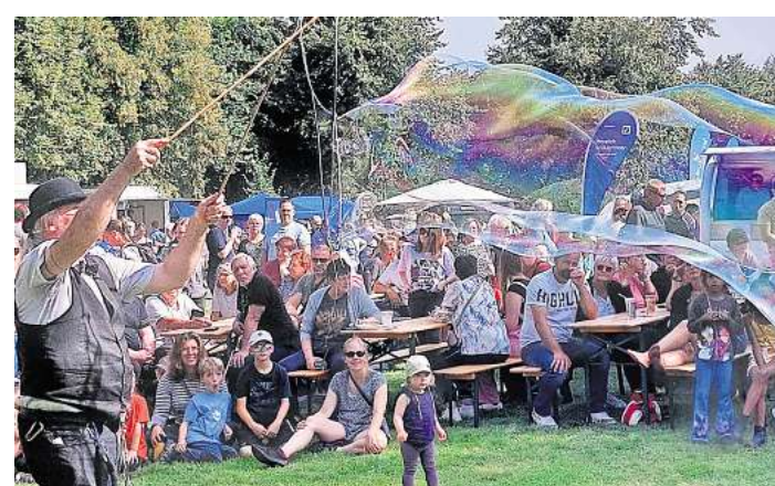
Zum Ende der Sommerferien feiert der Kiwanis Club am 7. September seinen 20. Kindertag auf der Amtswiese in Ahrensböck