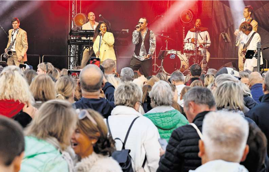
Die Band Max and Friends wird am 21. Juni 2025 das Kiwanis-Midsummer-Festival in Bad Schwartau rocken. So wie hier bei einem Konzert an der Seebrücke in Timmendorfer Strand.

Vorbereitungen für den 21. Juni laufen auf Hochtouren – Auszeichnung für Bad Schwartaus Serviceclub für Schuldinner-Projekt.