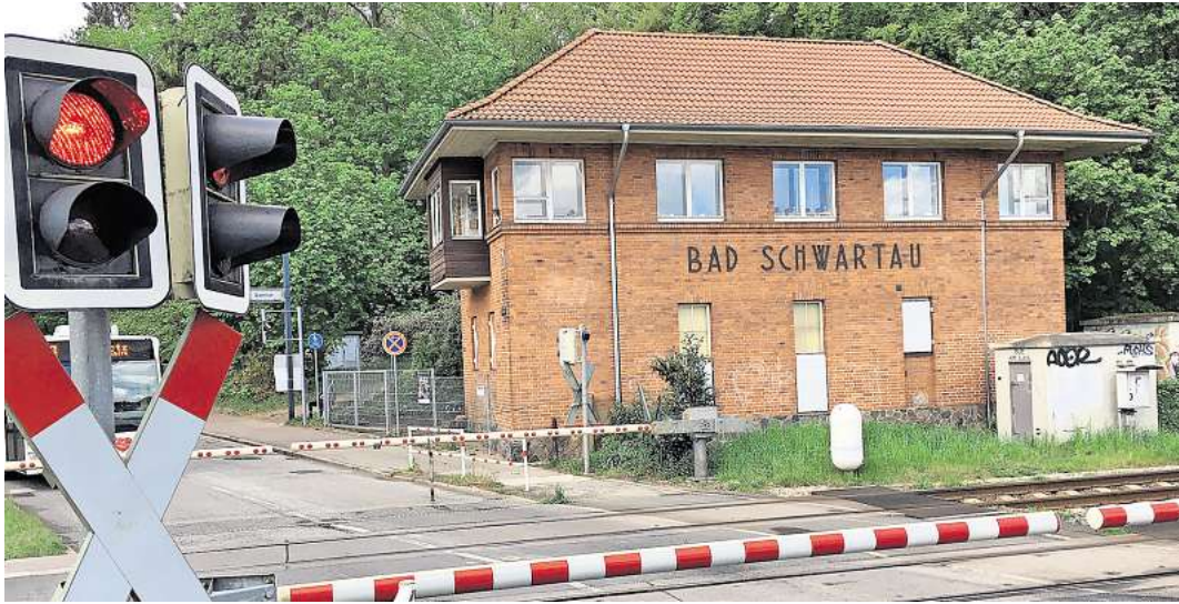
Der Bahnübergang Kaltenhöfer Straße in Bad Schwartau wird durch ein Brückenbauwerk ersetzt. Auf der Strecke durch das Wohngebiet sollen Güterzüge fahren.

Doch die Bahn plant aktuell noch mit veralteten Zahlen, weil das Bundesverkehrsministerium für die Stre-