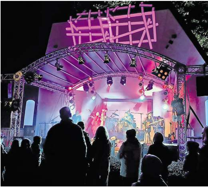
In diesem Jahr gibt es erneut ein Lichterfest im Kurpark Bad Schwartau. Termin ist am 17. und 18. Oktober.

In der ESG-Mensa sind Bastelstationen vorgesehen. Auch hier wird eine Crew der VHS die Kinder beim kreativen Basteln von Osterdekora-