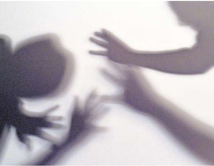
In Schleswig-Holstein haben in den letzten 12 Monaten nach Expertenangaben 36.640 Frauen sexuelle oder körperliche Gewalt in der Partnerschaft erlebt.

Der Verein Frauenberatung und Notruf Ostholstein berät Frauen zu allen Formen von Gewalt. Der Verein ist der einzige in Ostholstein, der sich