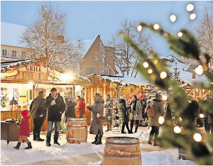
Rückblick auf 2023: Echte Tannenbäume, einheitliche Hütten und ein Boden aus Holzhackschnitzeln und Wege aus Holzbohlen schaffen gemütliche Atmosphäre auf dem Markt.