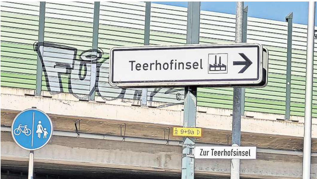
Keine Einigung über die Schreibweise: Das beweisen die beiden Verkehrsschilder in der Straße Tremskamp in Bad Schwartau.