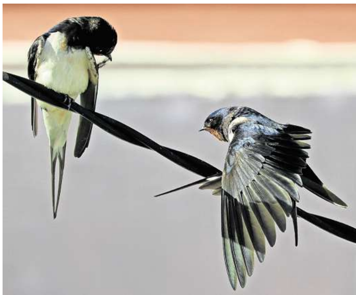
Schwalben willkommen! Der NABU zeichnet schwalbenfreundliche Hausbesitzer aus.

Viele weitere Tipps, um diesen Sommerboten zu helfen, gibt der NABU auf www.nabu.de/schwalben .