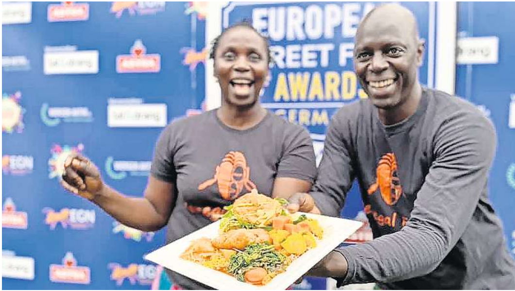
Speisen aus aller Welt werden beim Streetfood-Festival im Kurpark von Bad Schwartau vom 23. bis 25. August angeboten.