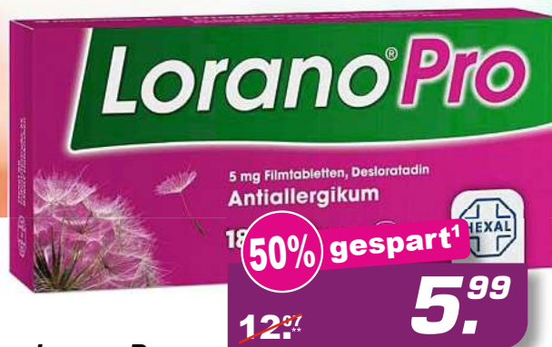
LoranoPro 18 Tabl. *