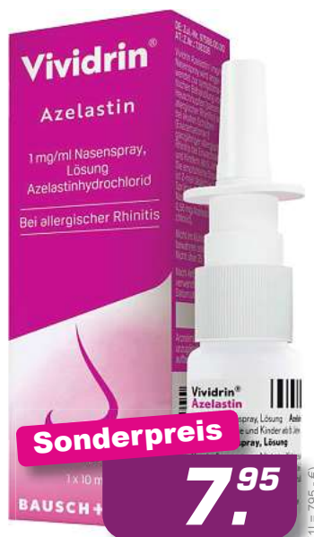
Vividrin Azelastin Nasenspray 10 ml *