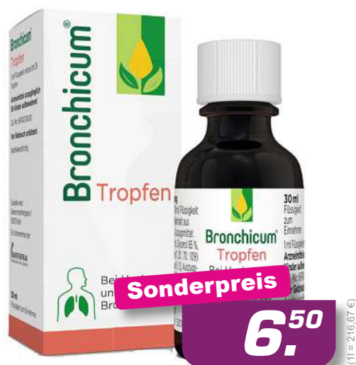
Bronchicum Tropfen 30 ml *