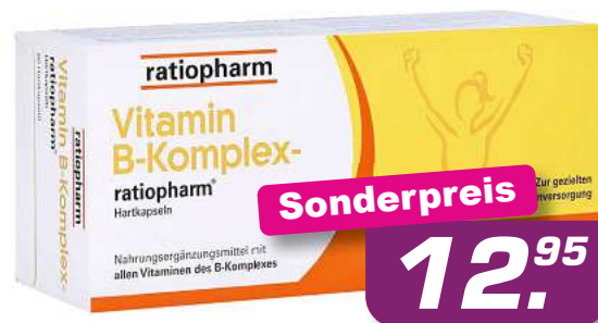
Vitamin B-Komplex Ratiopharm 60 Kaps. *