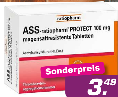
ASS Ratiopharm Protect 100 mg 100 Tabl. *