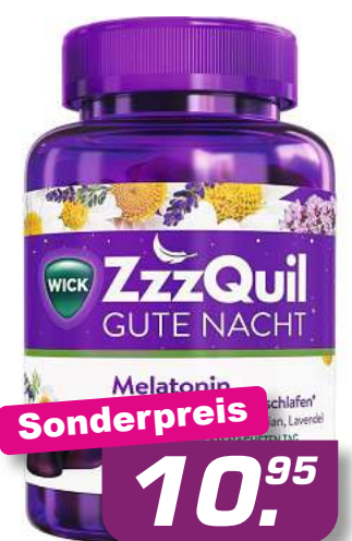
Wick Zzzquil Gute Nacht 30 Stk. *