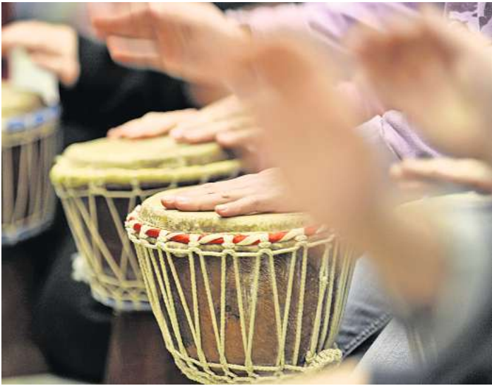
Die Musikpädagogen von Trommelapplaus werden bis zu 80 Kinder gleichzeitig in ihren Workshops einbeziehen.