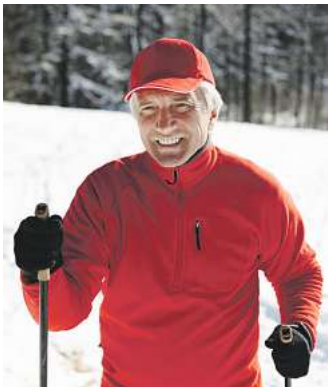
Abbildung Betroffenen nachempfunden PROSTACALMAN. Wirkstoffe: Serenoa repens, Pareira brava, Populus tremuloides. Dtl. D2. Prostacalman wird angewendet entsprechend den homöopathischen Arzneimittelbildern. Dazu gehören: Blasenentzündungen und Beschwerden beim Wasserlassen, bei vergrößerter Prostata. www.prostacalman.de • Zu Risiken und Nebenwirkungen lesen Sie die Packungsbeilage und fragen Sie Ihre Ärztin, Ihren Arzt oder in Ihrer Apotheke. • PharmaSGP GmbH, 82166 Gräfelfing