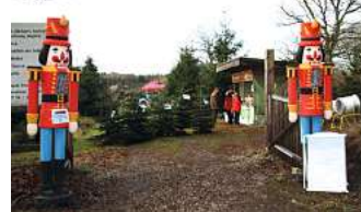
Der Bliestorfer Wald-Weihnachtsmarkt hat an drei Wochenenden geöffnet.

Forst Bliestorf Schenkenberger Weg, 23847 Bliestorf