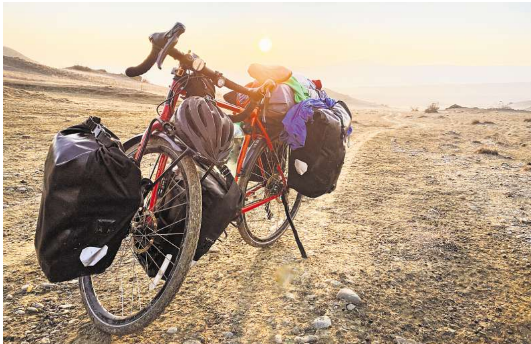
Auf mehrtägigen Touren zeigt sich, ob das Bike perfekt eingestellt ist.

Ist das Rad eingestellt, geht es an das Setup. Bei klassischen Radreisen kommen große Packtaschen zum Einsatz, meist am Gepäckträger. Sie bieten viel Stauraum und sind einfach zu organisieren.