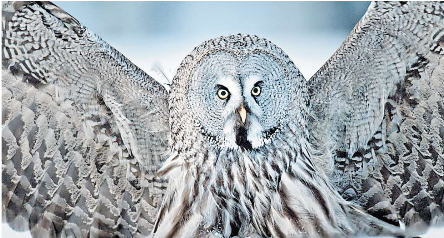
Ein Bartkauz in Skandinavien – aus der Dokumentarfilmreihe „Faszination Europa“.