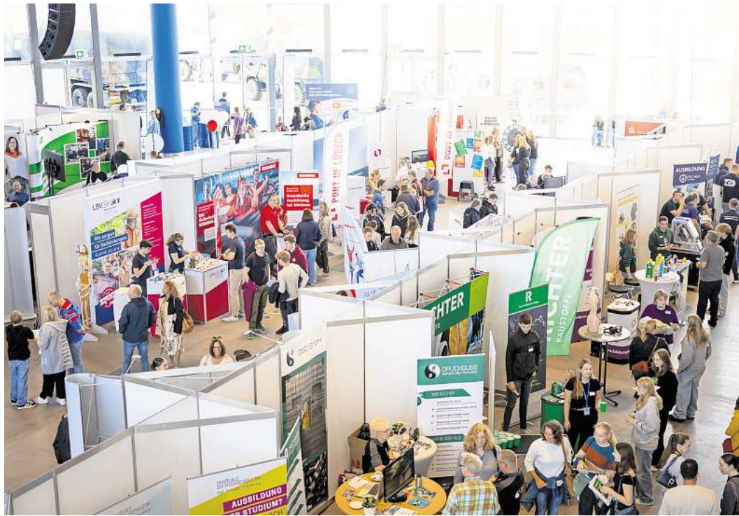
Volles Haus: Die gefragte LN-Azubiemeile im vergangenen Jahr in der Rotunde der Muk.

Insgesamt werden nach Auskunft des Veranstalters 102 Aussteller – darunter 71 Betriebe, 18 Hochschulen sowie Fachschulen und Institutionen – Rede und Antwort stehen. Zum weiteren Messeangebot gehören Vorträge zu Themen rund um Ausbildung und Studium. In der Muk gibt es zudem Informationen über das Freiwillige Soziale Jahr