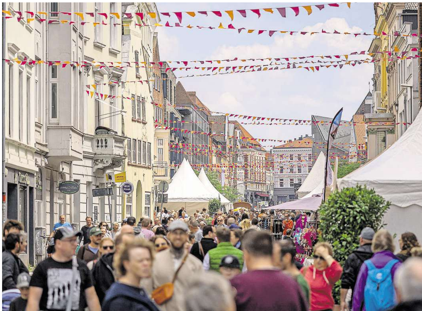
2024 fand das Hansekultur-Festival rund um das Gründungsquartier statt, hier eine Szene aus der Beckergrube.