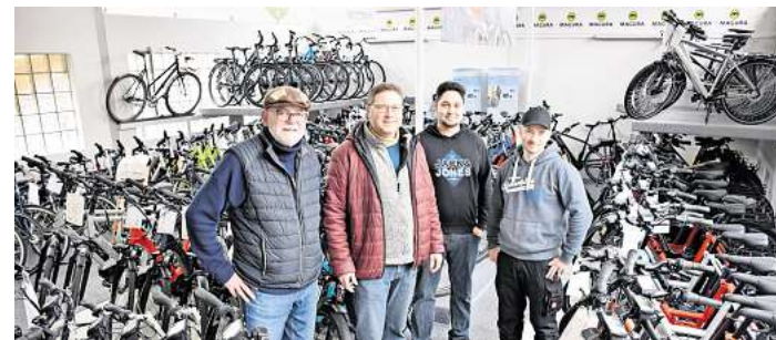
Das Team des „Fahr-Rad-Ladens“ berät kompetent rund ums Zweirad.

Wer jetzt auf den Geschmack gekommen ist, sollte sich im Fachhandel beraten lassen und das passende E-Bike oder Gravelbike inklusive Bike-Fitting auswählen. Im nächsten Schritt helfen Reisebüros und regionale Tourismusanbieter dabei, passende Touren zu finden und Mehrtagestouren unkompliziert zu buchen. CS