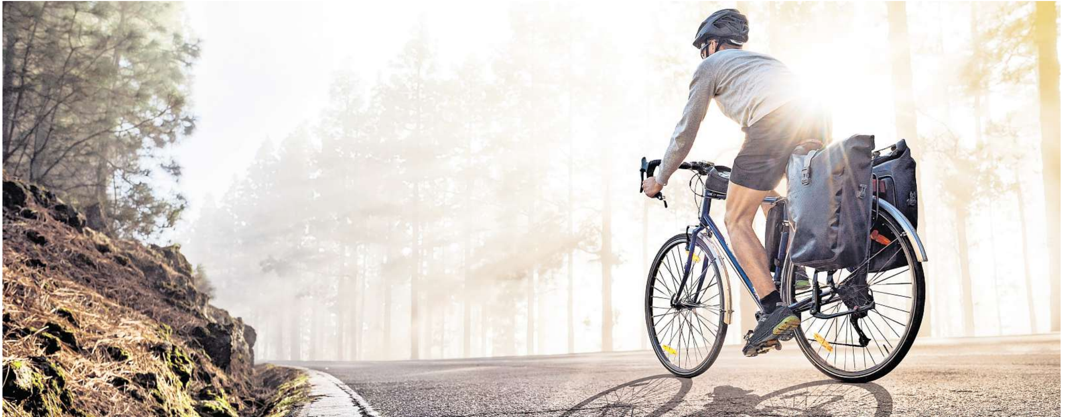
Eine mehrtägige Tour mit dem E-Bike oder Gravelbike will gut vorbereitet sein.