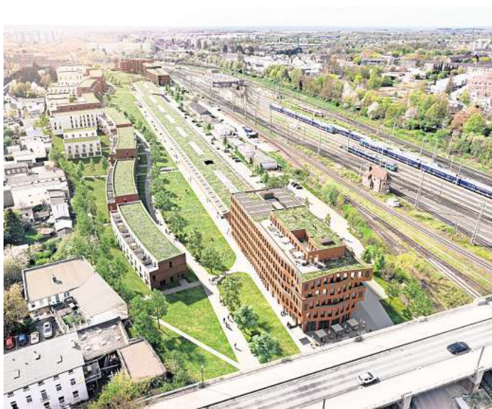
So soll das „Rioca – The Brazilian Design Hotel“ in Lübeck aussehen. Visualisierung: i Live Group GmbH

Auch in der Hansestadt bleibt es nicht bei dem Hotel: Direkt am Güterbahnhof 22, inmitten des neuen Quartiers „Neue Meile“, will die Gruppe noch in diesem Sommer den Baustart für ein Stu-