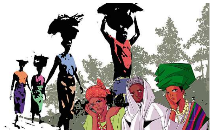
Das Bild zum Weltgebetstag 2026: „Rest for the Weary“ stammt von der Künstlerin Gift Amarachi Ottah.

Auch in den Evangelischen Kirchengemeinden in Ostholstein wird der Weltgebetstag ge-