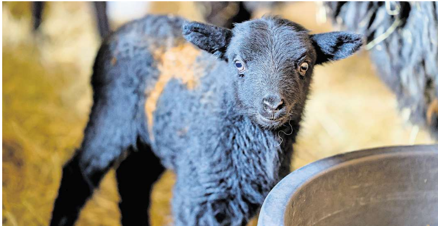
Neugierig guckt dieses kleine Lamm in die Kamera. Es ist erst wenige Wochen alt und wurde auf dem Hof des Landschaftspflegevereins Dummersdorfer Ufer geboren.

Zustellung: 0451/144-1826 Anzeigen: 0451/144-1111