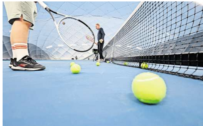
Die Tragflughalle auf der Sportanlage der Lübecker Turnerschaft an der Possehlstraße/Charlottenstraße wird derzeit unter anderem von der Oberschule zum Dom für den Sportunterricht genutzt.