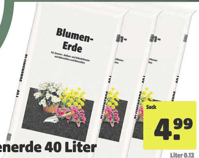
Blumenerde 40 Liter