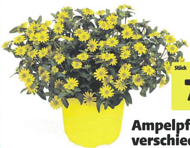
Ampelpflanzen verschieden Sorten