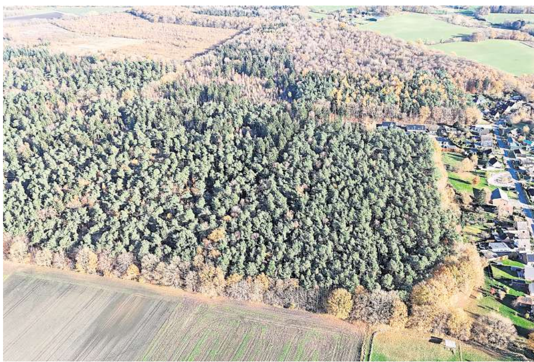
Für die Ternet-Trasse durchs Bartelsholz in Moorgarten gibt es noch keine Entscheidung.

Weil für diesen Abschnitt noch keine Einigung mit dem Flächen-eigentümer, eben der Hansestadt, hergestellt sei, werde hier