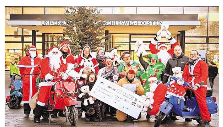
Groß war die Freude über die Spende für Klinik-Clowns.

Unter Beteiligung von Mayo Lübeck, Kiwanis Club Bad Schwartau, Edeka Center Ziegelstraße, Spedition Bode Reinfeld und dem Vespa Club Hamburg