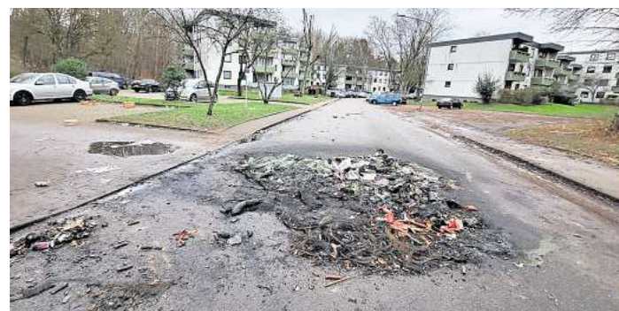
Am Neujahrstag 2025 waren die Überreste der Krawalle am Behaimring noch deutlich sichtbar.

Sie haben brennende Barrikaden errichtet, Böller und Raketen auf Polizisten und Nachbarn geworfen und geschossen, Feuerwehrleute daran gehindert, die Brände zu löschen. Wer die Täter waren, wollen Polizei und Staatsanwaltschaft in den vergangenen Monaten ermittelt haben. Dabei konnten die Ermittler auch auf Videoaufzeichnungen der Nacht zurückgreifen. Die Polizei hatte im Frühjahr eigens ein On-