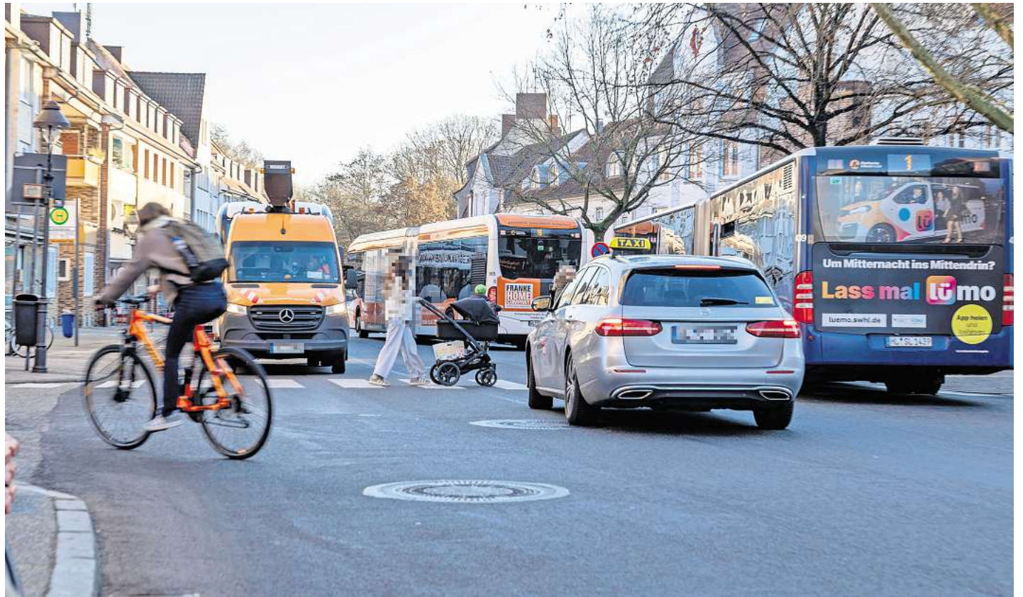
Die Krähenstraße ist seit der Sperrung der Mühlenbrücke stark frequentiert. Aber es hält nur ein Teil der Busse dort.