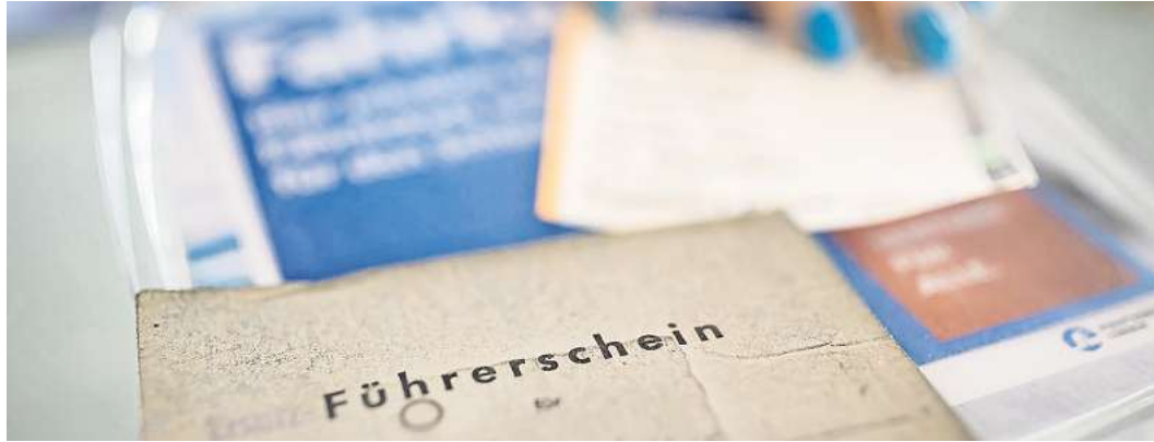
Die Hansestadt Lübeck bietet ÖPNV-Jahreskarte für Rückgabe des Führerscheins. Doch die Aktion endet bald.

LÜBECK. Seit 2022 bekommen Lübecker, die freiwillig ihren Führerschein abgeben, eine ÖPNV-Jahreskarte. Die Stadt will so Anreize für die Nutzung von Bus und Bahn schaffen. Die Nachfrage war durchweg groß. Aufgrund der schlechten Haushaltslage wird die Aktion nun jedoch zum Jahresende auslaufen. 291.000 Euro Einsparung verspricht sich die Stadt davon. 20 bis 40 Anträge gehen aktuell pro Monat auf www.luebeck.deoder in den Bürgerservicebüros ein.