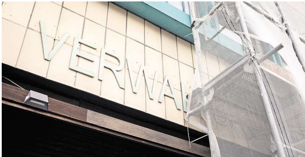
Das Verwaltungszentrum Mühlentor ist Sitz zahlreicher städtischer Behörden. Die Zahl der Arbeitsplätze wird erst einmal nicht wachsen.