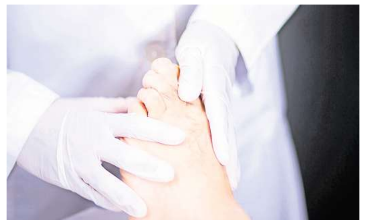
Ein akuter Gichtanfall verursacht starke Schmerzen und beginnt häufig im Grundgelenk der Großzehe.

Zu viel Harnsäure im Blut (Hyperurikämie) bildet sich, wenn der Körper sie nicht über die Nieren ausscheiden kann. Sie lagert sich