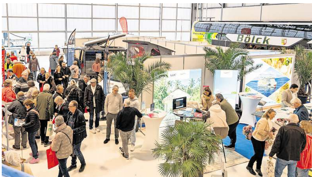
Die LN-Reisemesse NordZEIT findet am Lübecker Flughafen statt.

In 17 Fachvorträgen wollen Reiseexperten Lust auf die schönste Zeit des Jahres machen. Unter anderem gibt es detaillierte Informationen zu Busreise-Highlights vom Reisinger Hamburg, Aida-Weltreise-Impressionen