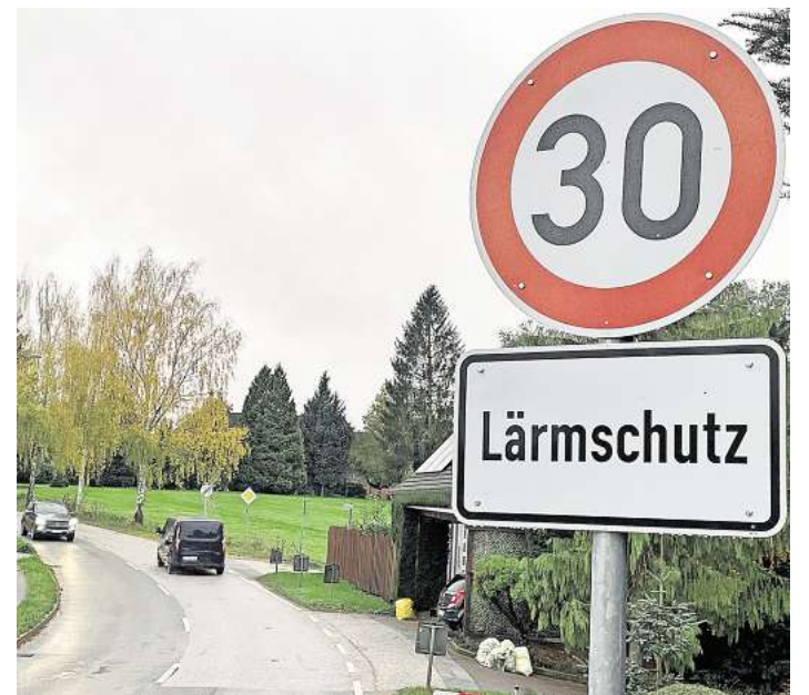
Seit Kurzem gilt auf der Kronsforde Hauptstraße Tempo 30. Aber nur auf wenigen Metern.

Die Stadtverwaltung erläutert, dass bei der Straßenverkehrsbehörde ein entsprechender Antrag gestellt worden sei, der genau den entsprechenden Bereich betreffe. „Solch eine Tempo 30-Strecke ist nicht ungewöhnlich“, heißt es von der Pressestelle der Verwaltung. Es gebe entsprechend begrenzte Strecken auch zum Beispiel vor Schulen und Al-