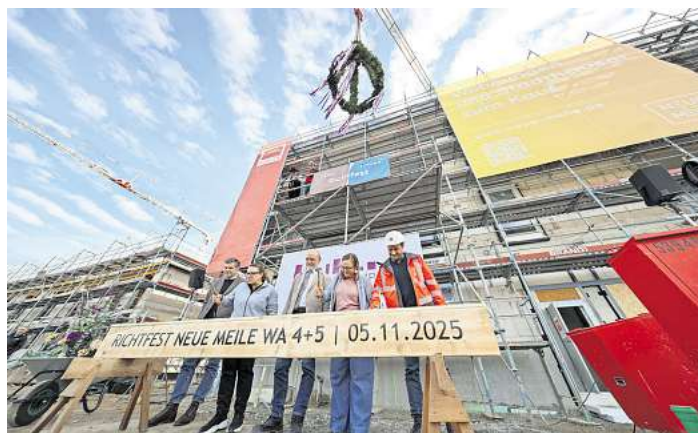
Vertreter des Bauherren Wohnkompanie Nord und des Generalunternehmers Köster Bau feierten Richtfest auf der Neuen Meile in Lübeck.

„Mit der Neuen Meile Lübeck wandelt sich ein ehemaliges Industrieareal zu einem zukunftsorientierten Stadtquartier“, schreibt die Wohnkompanie Nord. Das Hamburger Unternehmen entwickelt diesen Ort seit 2017. Wohnen, Arbeiten und Freizeit sollen nahe dem Lübe-