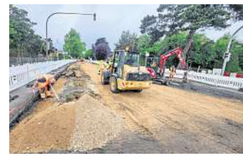
Dauerbaustelle: In diesem Jahr wurde die Moislinger Allee grundsaniiert.

Für die Jahre 2021 bis 2025 hatte die Verwaltung einen Masterplan Straßen aufgelegt. Mit zehn Millionen Euro pro Jahr wurden