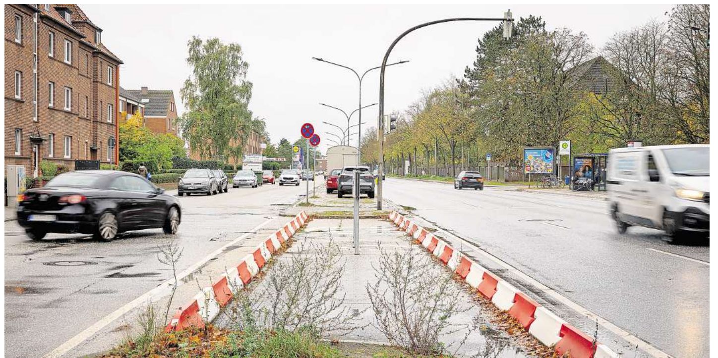
Von der Oderstraße aus gelangen Verkehrsteilnehmer nicht mehr auf die Schwartauer Landstraße. Die Zufahrt ist baulich blockiert.