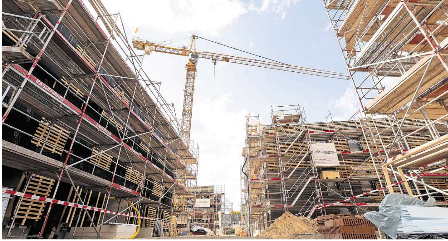
139 neue Wohnungen baut die Grundstücksgesellschaft „Trave“ in St. Lorenz Nord auf dem früheren Grundstück eines städtischen Altheims.

87 Wohnungen baut die städtische Grundstücksgesellschaft,