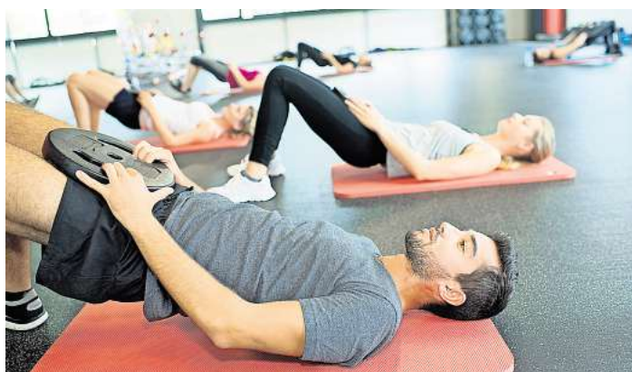
Demnächst starten in Lübeck und im Kreis Ostholstein noch Kurse mit freien Kursplätzen.

Wer Lust auf ein echtes Kraftworkout mit und ohne Gerät in einem Fitnessstudio in Travemünde oder Lübeck hat, der ist im AOK-Kurs „Kraftworkout im Studio“ genau richtig. In zehn Wochen geht es rund um das Thema Muskelaufbau, Tipps zu Bewegungsmöglichkeiten im Alltag und echte Fitness. Trainiert wird in der Gruppe und doch ganz individuell. Auch ein sehr effektives Trainingsprogramm für zu Hause ist Bestandteil dieses neuen Kurskonzepts. Der zehnwöchige Kurs beginnt am 3. November in Travemünde und am jeweils 4. und 5. November in Lübeck.