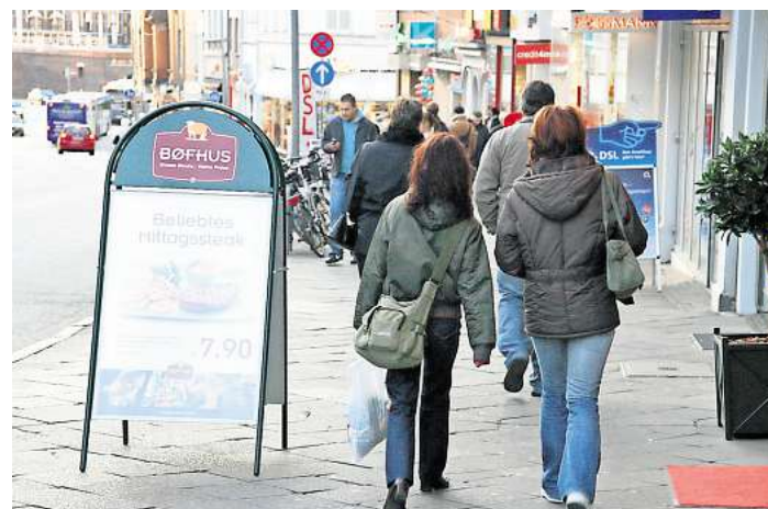
Die Hansestadt will in Gesprächen mit Gewerbetreibenden für eine dezente Außenwerbung sorgen. Unser Archivbild zeigt einen Aufsteller in der Holstenstraße.

Die Werbeanlagensatzung für die Altstadtbereiche Lübeck und Lübeck-Travemünde sieht laut Verwaltung vor, dass ein Schriftzug aus Einzelbuchstaben parallel zur Gebäudefront sowie ein Ausleger im rechten Winkel zur Fassade zulässig sind. Diese kön-