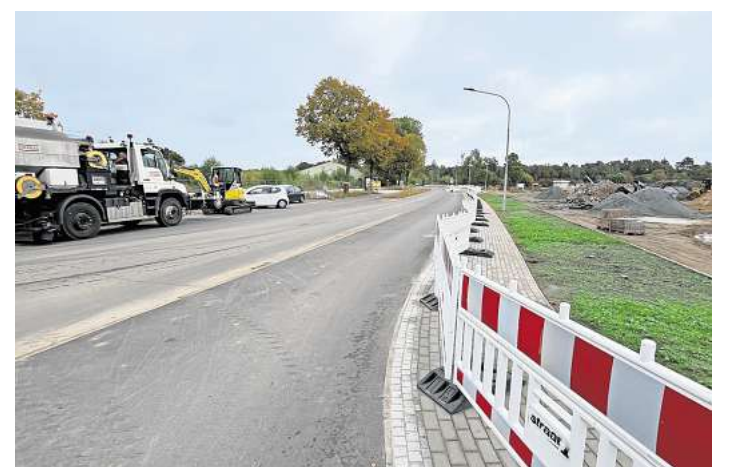
Die letzten Arbeiten laufen: Am 14. Oktober wird die Schlutuper Straße in Lübeck für den Verkehr freigegeben.

Der gesamte Bereich auf Marli ist seit Januar eine Großbaustelle – mit direkten Auswirkungen auf den gesamten Stadtteil. Denn sowohl der Linienverkehr als auch der Individualverkehr werden seit Beginn des Jahres umgeleitet. Um die Baustelle zu umfahren, rollen Pkw und Busse seitdem über den Marling und die Arnimstraße.