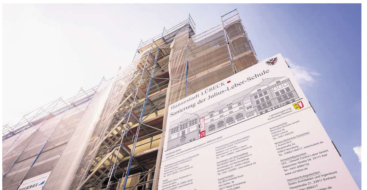
Das Gebäudemanagement der Stadt will seine Strukturen effizienter machen – hier ein Archibild von der Sanierung der Julius-Leber-Schule im Jahr 2022.