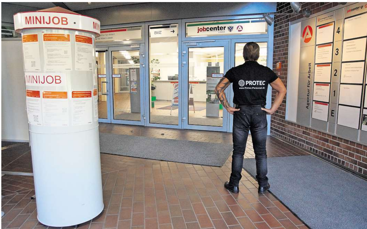
Auch das Jobcenter Lübeck muss auf Sicherheitsdienste zurückgreifen.