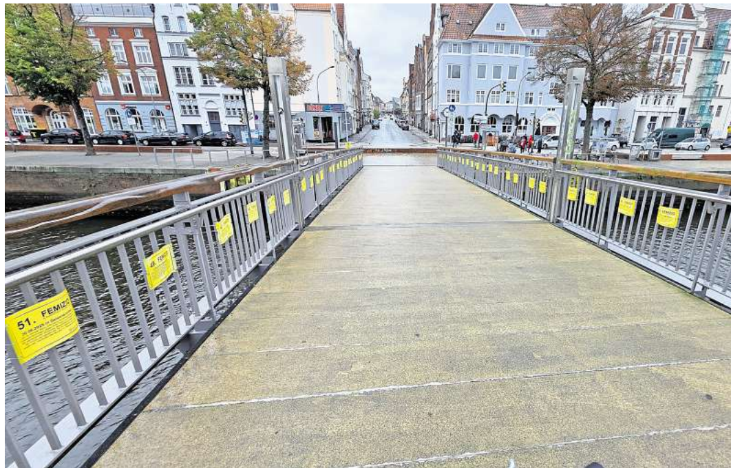
Das Bündnis „FemStreik Lübeck“ hat Schilder an der MuK-Brücke befestigt, die an die Femizide in Deutschland erinnern.

Andere Maßnahmen dagegen kosten Geld. Die Einrichtung von Schutzwohnungen für Frauen, die mit ihren Kindern vor der Gewalt der Partner fliehen, wird auf mindestens 90.000 geschätzt.