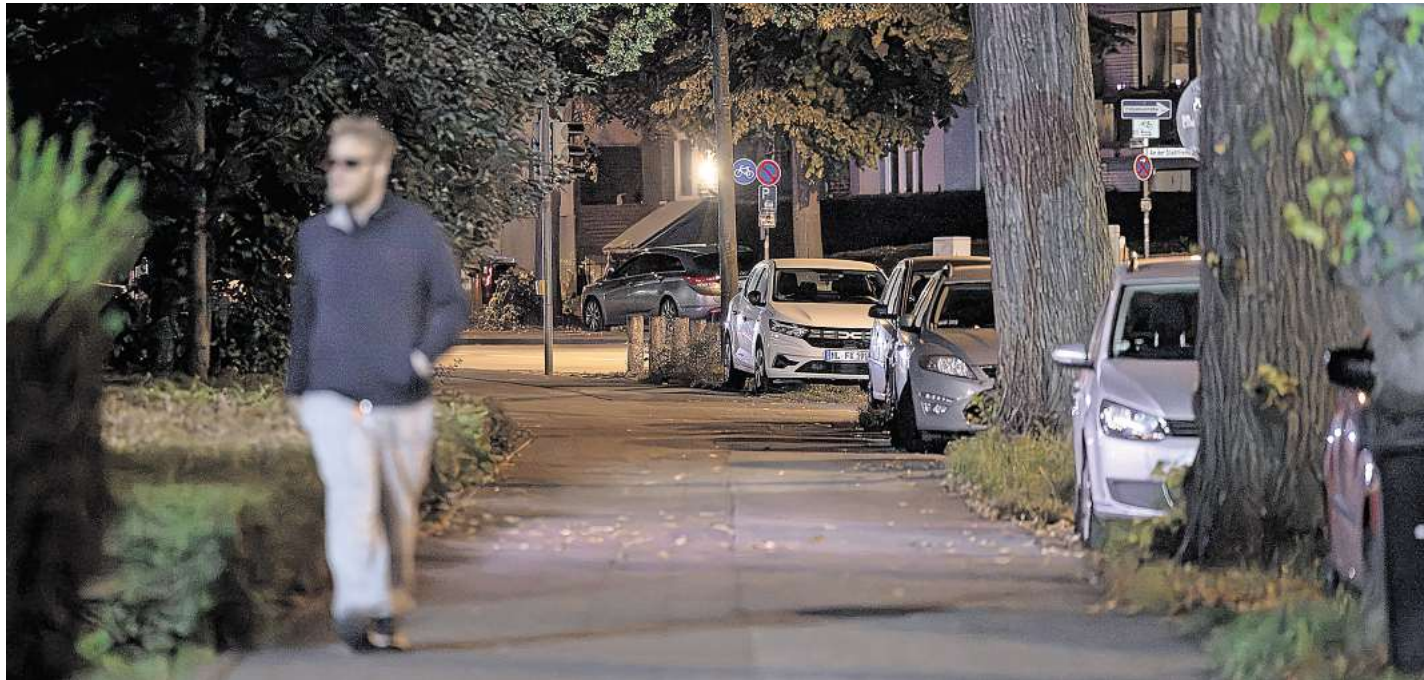
Dunkle, zugeparkte Gehwege erzeugen oftmals ein Unsicherheitsgefühl.

„Eins vorab“, merkt sie an, „natürlich ist ein Unsicherheitsgefühl immer subjektiv geprägt, also von Mensch zu Mensch sehr