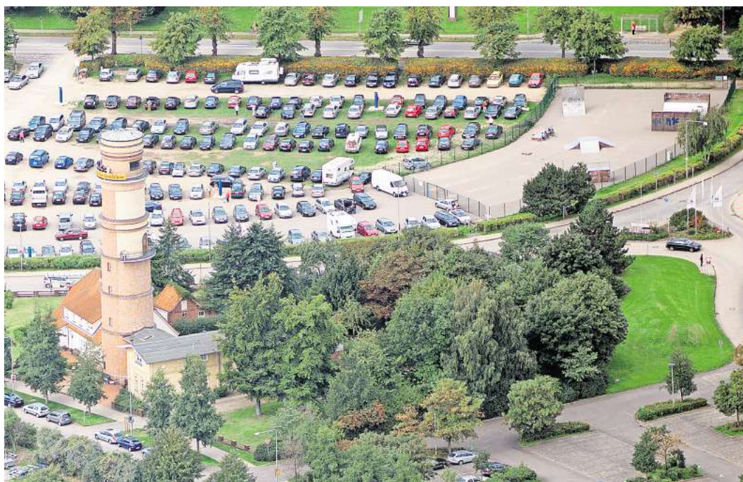
Wird aus dem Leuchtenfeld ein Landschaftspark? Darüber wird die Lübecker Politik in den kommenden Wochen debattieren.

Einem ähnlich lautenden Antrag von Linke & GAL war es im Sommer ähnlich gegangen. Der