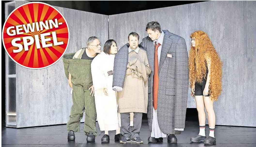
Eine Szene aus „Das beispielhafte Leben des Samuel W.“.