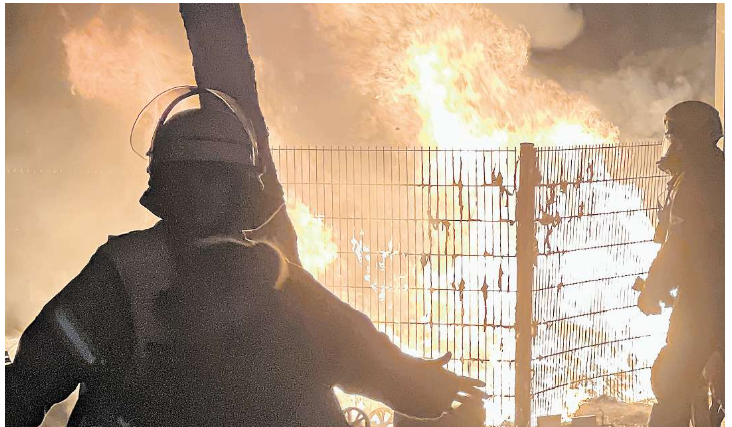
Ein Feuerwehrmann steht in der Silvesternacht von 2023 auf 2024 vor einem brennenden Müllcontainer im Behaimring. Im Folgejahr sah es genauso aus.