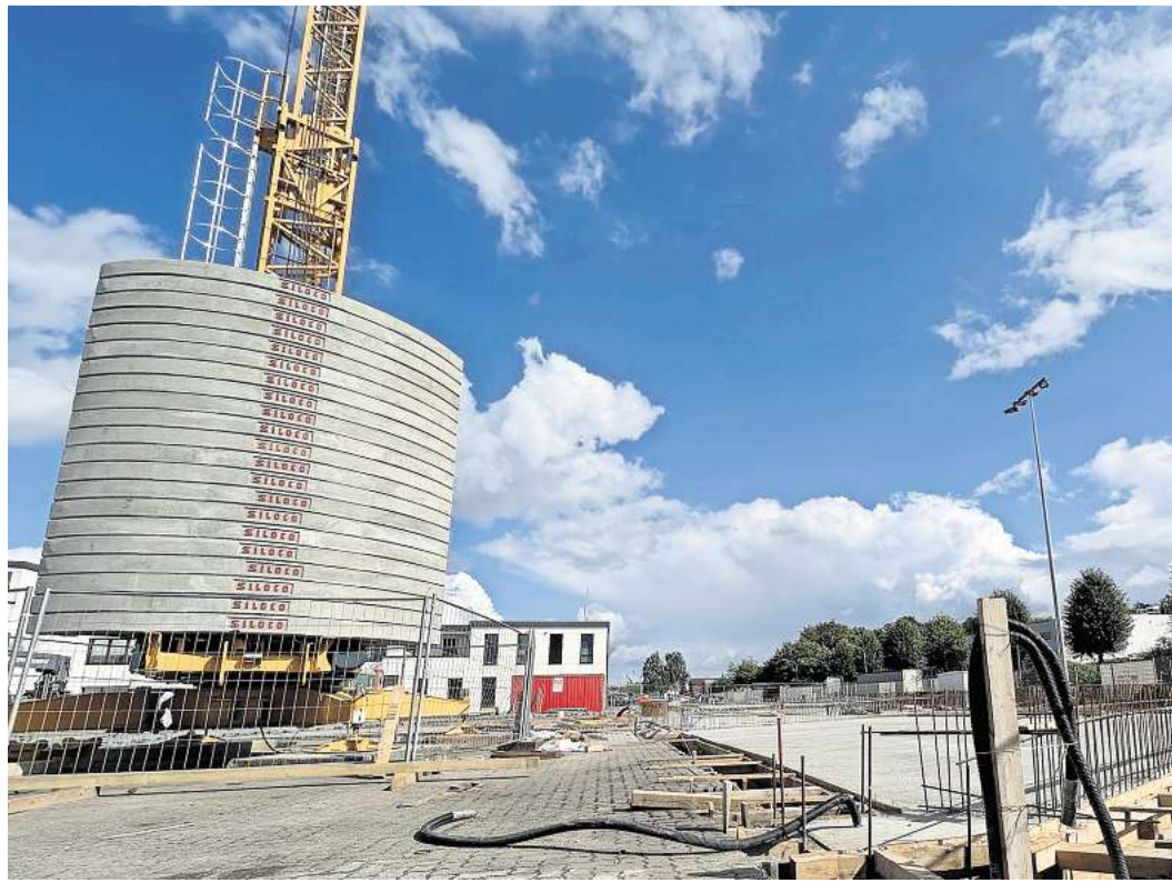
Im Gewerbegebiet Roggenhorst entsteht Lübecks erste Wasserstofftankstelle. Die Bauarbeiten haben im August begonnen.

Gebaut wird auf dem Gelände der Firma Combisped, auf dem bereits eine Dieseltankstelle für den Schwerlastverkehr steht. Die Tankstelle wird durch Schlagbäume gesichert, die Nutzer werden über Kennzeichen-Erkennung registriert und zur Kasse gebeten. Bis zu zwei Tonnen Kraftstoff aus Wasserstoff kann hier täglich abgegeben werden. Der Kraftstoff wird nicht vor Ort erzeugt, sondern angeliefert.