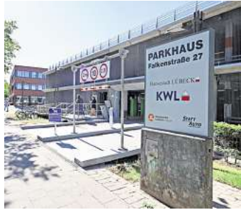
Das Parkhaus Falkenstraße ist seit dem 25. September wieder für alle geöffnet: für Kurzzeitparker und Dauermieter.

LÜBECK. Nach sechs Monaten Teileröffnung heißt es nun endlich: Freie Fahrt für alle – oder genauer gesagt: Parken für alle! Das Parkhaus Falkenstraße ist nach einer umfassenden Sanierung wieder komplett nutzbar – nicht nur für Dauermieter, sondern auch für Kurzzeitparkende.