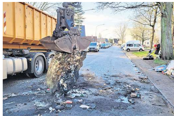
Haufenweise Müll musste die Straßenreinigung der Lübecker Entsorgungsbetriebe Anfang Januar 2025 im Behaimring entsorgen. Das Ergebnis einer chaotischen Silvesternacht in Eichholz.