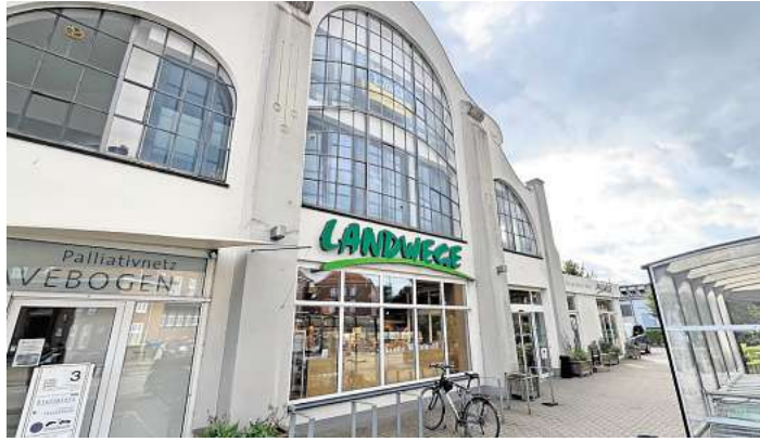
Dunkle Wolken über Landwege. Die Genossenschaft ist insolvent, hat nun aber einen Sanierungsplan vorgelegt.

Was zusammenzubringen ist, ist komplex: Es geht um neue und alte Mitglieder, um Genossenschaftsanteile, um mögliche