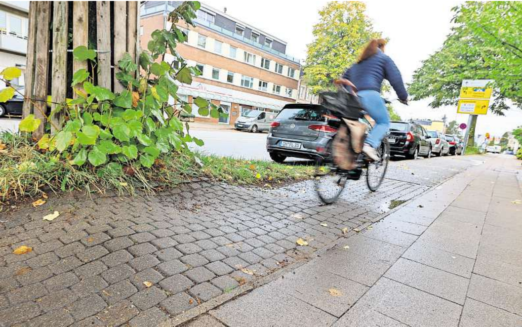
Schmale und holprige Wege – wie hier in der Kronsforder Allee – zählen zu den größten Kritikpunkten an den Radwegen.