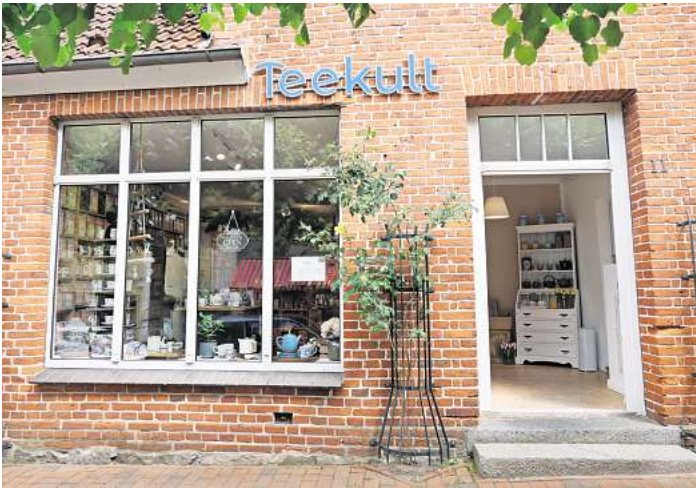
Das Geschäft Teekult befindet sich seit elf Monaten an der Lübecker Straße in Bad Schwartau