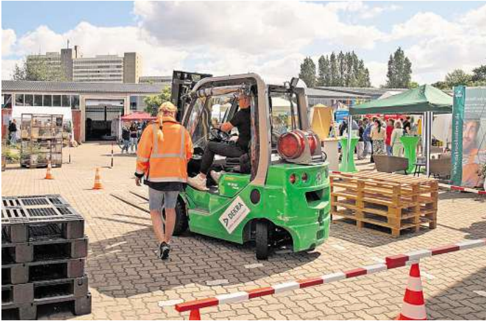
Die Messe stellt Berufe im Handwerk vor.

Bei der Messe gibt es Einblicke in folgende Berufsfelder: Abwasser und Entsorgung, Busverkehr, Dachdeckerei und Tischlerei, Digitalisierung, Elektro- und Sanitär, Energie, Fleisch- und Wurstverarbeitung, Fliesenleger- und Maurerhandwerk, Friseurhandwerk, Garten- und Landschaftsbau, Gas-, Wasser-, Heizungs- sowie Lüftungs- und