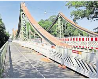
Die Mühlentorbrücke zeigt deutliche Alterserscheinungen. Besonders die alten Geh- und Radwege machen Sorgen. Für die Arbeiten muss die Brücke ab Ende Juli gesperrt werden.

Während der gesamten Bauzeit ist die Brücke stadteinwärts gesperrt. Stadtauswärts bleibt sie befahrbar. Für Autos und Liefer-