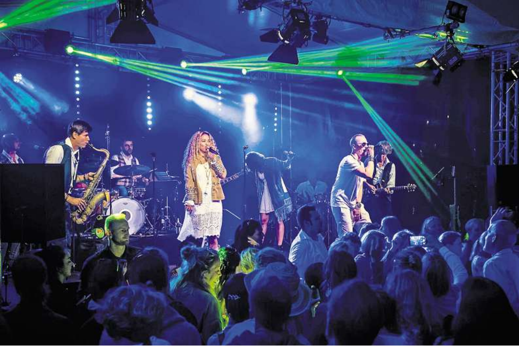
Sie wollen Schlutup einheizen: Max and Friends geben am 5. Juli ein Konzert im Stadtteil.

Ein besonderer Programmpunkt am Hafen ist das Mitmachkonzert „Schlutup singt“ der Willy-Brandt-Schule mit Schülern, Eltern und Großeltern (Sonnabend, 17 Uhr). Es wird zahlreiche weitere Attraktionen wie Hundesport-Vorführungen