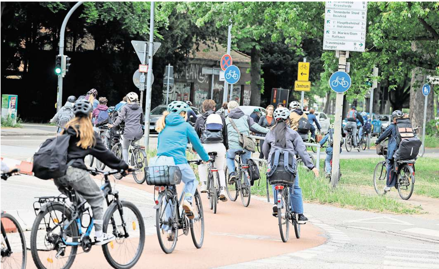
Morgens um 7.30 Uhr auf dem Mühlentorplatz: Hunderte Schülerinnen und Schüler radeln in Pulken durch den Kreisverkehr.

Die im Herbst 2023 vorgenommene Entschärfung des Kreisels hat laut Polizei zu einer Verringerung der Unfälle geführt. Aber der jetzige Zustand ist eine provi-