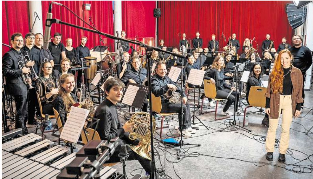
Das Sinfonische Blasorchester Ratekau gastiert in der MuK.

LÜBECK/ TIMMENDORFER STRAND. Am Pfingstmontag um 11 Uhr startet eine 55 Kilometer lange Radtour des ADFC am Bahnhof Timmendorfer Strand über Neustadt zur Wassermühle Hasselburg. Es besteht die Möglichkeit, an einer Führung in der Mühle teilzunehmen. Für das leibliche Wohl gibt es Leckerer vom Grill, Fischbrötchen und Kaffee und Kuchen. Zurück geht es über Övelgönne und den Pönitzer See zum Bahnhof Timmendorfer Strand. Anmeldung und weitere Details unter https://touren-termine.adfc.de .