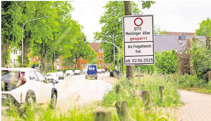
Überall wird gebaut: Besonders die Sanierung der Moislinger Allee macht Autofahrern zurzeit das Leben schwer.

Bleibt eigentlich nur noch die Autobahn über die Anschlussstelle Zentrum bis Moisling. Aber wenn – wie gestern geschehen – auf dem Autobahnabschnitt ein Unfall passiert, herrscht absolutes Chaos. Denn Autofahrer wollen in dem Fall die A1 so schnell wie möglich verlassen – und verstopfen die Straßen, wie bei-