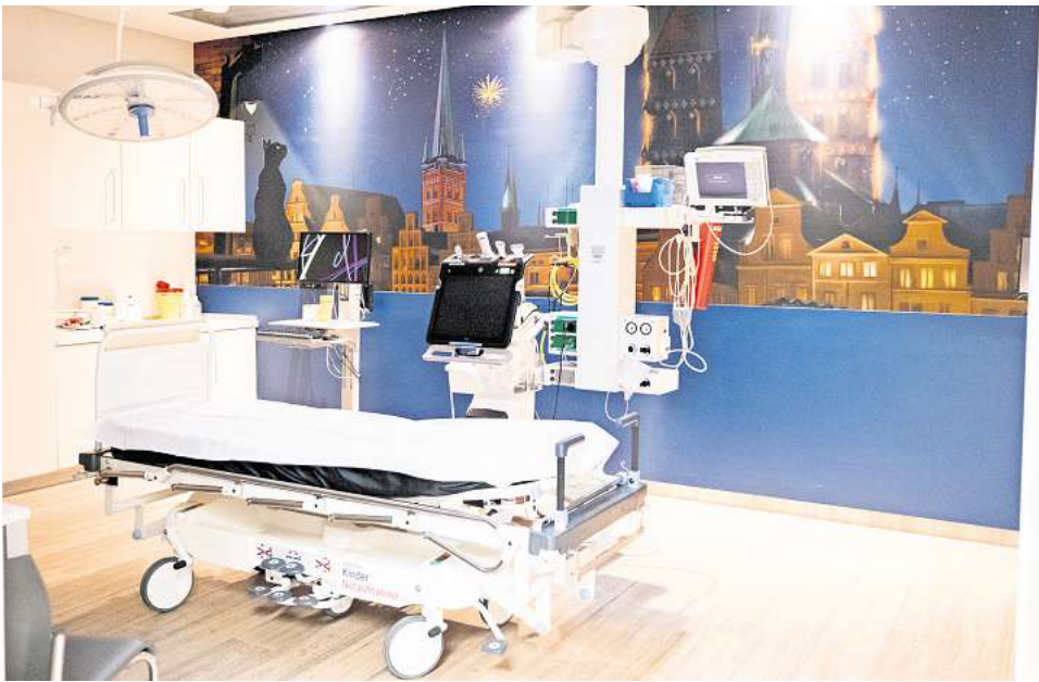
Die Kindernotaufnahme wurde kinderfreundlicher und moderner gestaltet.