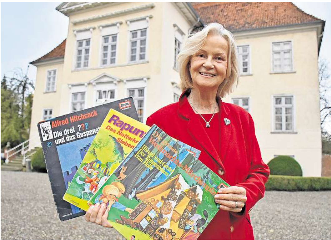
Der Hörspielproduzentin Heikedine Körting verdanken Millionen großer und kleiner Kinder den Stoff für süße Träume.

EUTIN. Eine Hörspiel-Legende, ein Kult-Sprecher, ein renommierter Stummfilmpianist und einer der bekanntesten Krimiautoren Norddeutschlands – die Highlights der „4. Eutiner Hitchcock-Days“ versprechen großes Kino. Vom 6. bis zum 28. September locken insgesamt 14 Veranstaltungen, die sich mal mehr, mal weniger intensiv mit dem Meisterregisseur beschäftigen, in die Rosenstadt. Stargast ist die Hörspielproduzentin Heikedine Körting – die „Königin der Hörspiele“ stellt. Körting lebte jahrzehntelange auf dem Gut Hasselburg in Ostholstein und hat im Hamburger „Europa“-Tonstudio über 3.000 Hörspiele inszeniert – darunter Erfolgsserien wie „Die drei ???“, „TKKG“, „Fünf Freunde“ oder „Hanni und Nanni“. Offen wie nie hat sie mit Christian Rodenwald über ihre Arbeit und ihr Leben gesprochen, mehr als zwei Jahre arbeitete der Berliner Historiker an dem Buch. Es ist das Porträt einer einzigartigen Frau, deren Markenzeichen Fröhlichkeit, Leidenschaft und unbändige Energie sind. In der Operscheune der Eutiner Festspiele erwartet die Besucher ein spannender Talk und die eine oder andere Überraschung. Den Anfang aber macht eine Plakatausstellung in der Kreisbibliothek Eutin, die am 6. September eröffnet wird. Zu sehen sind