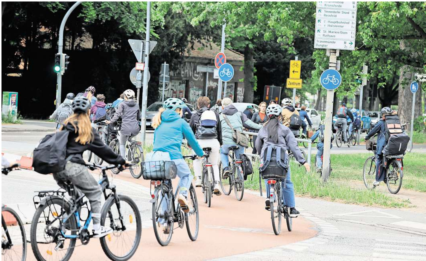
Morgens um 7.30 Uhr auf dem Mühlentorplatz: Hunderte Schülerinnen und Schüler radeln in Pulken durch den Kreisverkehr.

Die im Herbst 2023 vorgenommene Entschärfung des Kreisels hat laut Polizei zu einer Verringerung der Unfälle geführt. Aber der jetzige Zustand ist eine provi-