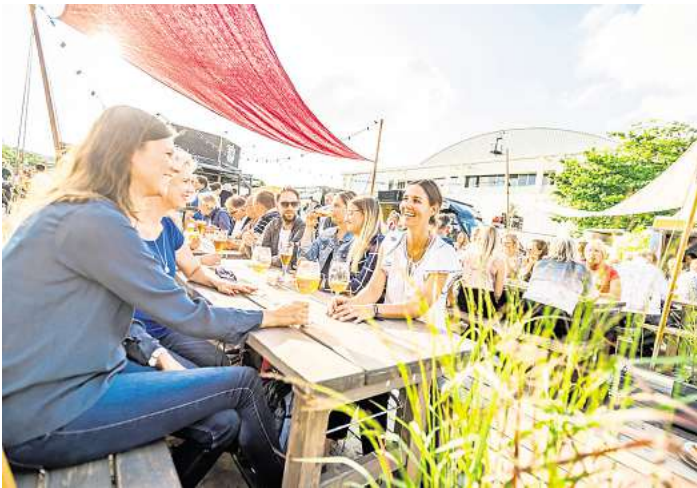
Beste Stimmung herrschte am Traveufer während des Ducksteinfestivals – hier im Bild. Bei den Fehmarnbelt Days im Juni soll es ähnlich fröhlich zugehen.

Interessierte können ein Bild vom Leben in der Fehmarnbelt-Region gestalten. Die Visionen werden direkt vor Ort ausge-