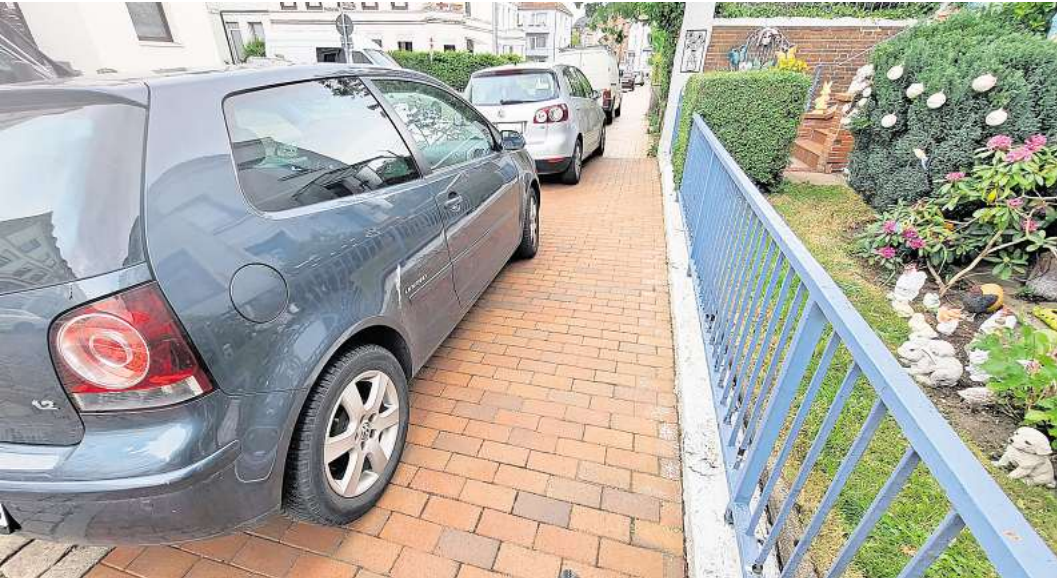
Kein Platz für Eltern mit Kinderwagen: In der Georgstraße in St. Lorenz Süd in Lübeck ist das Parken auf dem Gehweg verboten, doch viele Autofahrer halten sich nicht daran.