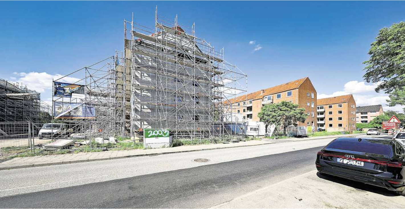
Gewaltige Gerüste umgeben einen Wohnblock der „Trave“ in der Schönböckener Straße. Die Grundstücksgesellschaft modernisiert hier 120 Wohnungen mit neuer Technik.

Die Fassaden in Holzrahmenbauweise werden in vier Wochen