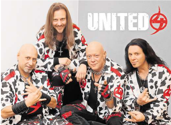
UNITED4 präsentieren ihre Show in Dornbreite.

Am Samstag und Sonntag findet dann ein buntes Familienpro-