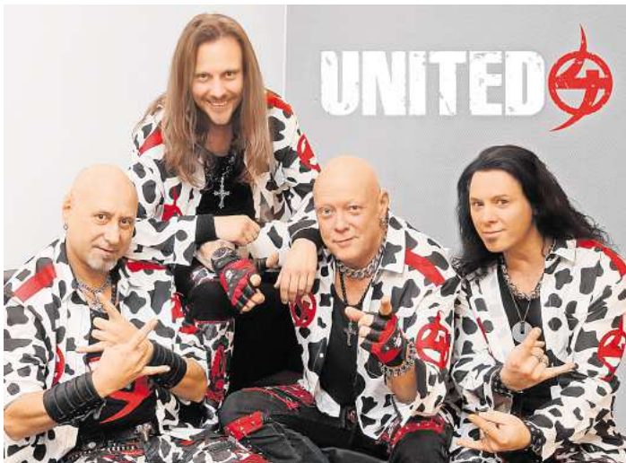
UNITED4 präsentieren ihre Show in Dornbreite.

Am Samstag und Sonntag findet dann ein buntes Familienpro-