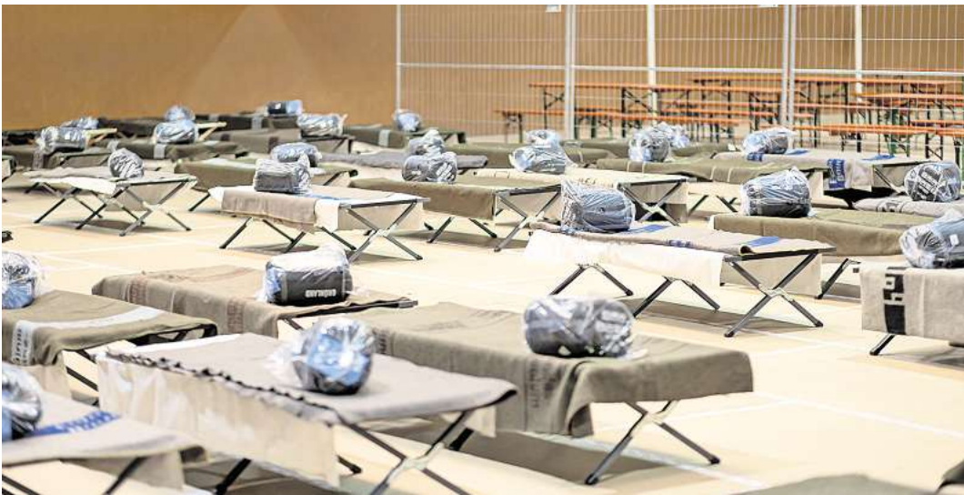
In Krisen muss sich die Hansestadt Gedanken über die Unterbringung von Bürgern machen – wie zuletzt bei der Zuwanderung von Geflüchteten. Unser Archivbild zeigt die damalige Notunterkunft in der Heinrich Mann Schule.

Der stundenlange Stromausfall im Mai 2018, der weite Teile der Stadt lahmlegte, ist vielen Bürgern noch gut in Erinnerung. Als die Corona-Pandemie ausbrach, gab es auch in Lübeck einen Mangel an Masken. Für die Beschäftig-