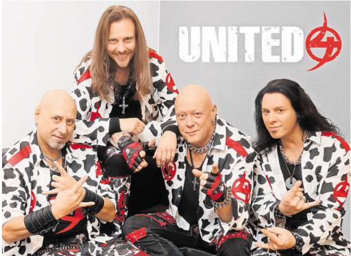
UNITED4 präsentieren ihre Show in Dornbreite.

Am Samstag und Sonntag findet dann ein buntes Familienpro-