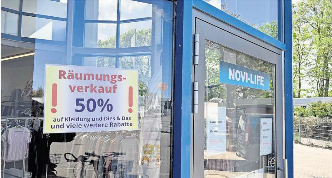
Im Laden an der Straße Im Gleisdreieck können die Novi-Life-Kunden jetzt noch günstiger einkaufen.

Die FAW und das Lübecker Jobcenter betreiben die Sozialkaufhäuser in den Stadtteilen Kück-