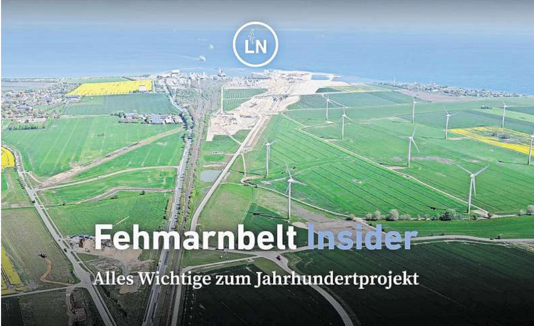
Den Newsletter Fehmarnbelt Insider gibt es immer am zweiten Donnerstag im Monat.

Deutschlands Beitrag ist für über 3,9 Milliarden Euro eine 88 Kilometer lange Schienenstrecke samt Fehmarnsundtunnel. Auf