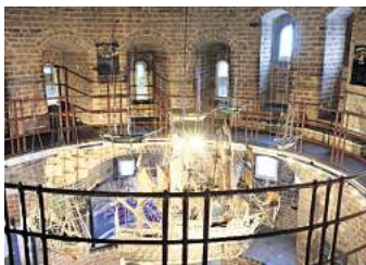
Im Museum Holstentor gibt es Sonntag verschiedene Führungen.

Das Buddenbrookhaus beleuchtet unter dem Schlagwort „Buddenbrooks privat“ in Kurzführungen aus der Perspektive verschiedener Protagonisten ein-