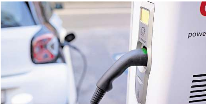
Die Zahl der Elektroautos in Lübeck wächst, die Hansestadt will das Angebot der E-Ladesäulen weiter ausbauen.

Zum Vergleich: 2025 rollen auf Deutschlands Straßen 49,3 Millionen Pkw. Rein elektrische Autos machen lediglich 3,3 Pro-