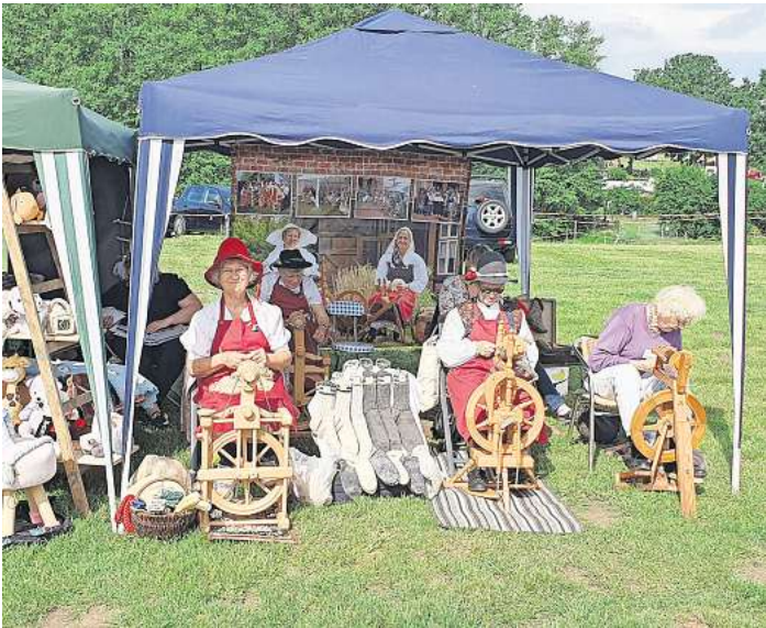
Am 18. Mai findet auf dem Bauernhof der Familie Löding das bereits 18. Spargelfest mit Kunsthandwerkermarkt statt.

BUCHHOLZ. Am Sonntag, 18. Mai, lädt Familie Löding zum 18. Mal zum traditionellen Spargelfest mit Kunsthandwerkermarkt auf ihren Bauernhof am Ratzeburger See ein. Von 10 bis 18 Uhr erwartet die Besucherinnen und Besucher ein vielfältiges Programm rund um den Spargel, gepaart mit regionalem Handwerk, Musik und Aktionen für die ganze Familie. Eröffnet wird das Fest um 10 Uhr mit einem Feldgottesdienst der Kirchengemeinde St. Georg auf dem Berge. Anschließend sorgen „Motion Events“ mit Live-Musik für die passende Atmosphäre. Rund 30 Kunsthandwerkerinnen und Kunsthandwerker aus der Region präsentieren ihre liebevoll gefertigten Produkte – von genähter Kinderkleidung und Dekorationsartikeln über Holzarbeiten und Schmuck bis hin zu handgefertigten Tassen, Rapskissen und Türkränzen. Auch das Lübecker Kräuteraus ist vertreten, ebenso ein professioneller Messer- und Scherenschleifer.