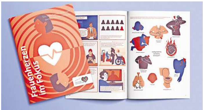
Den Comic der Herzstiftung kann man bestellen.