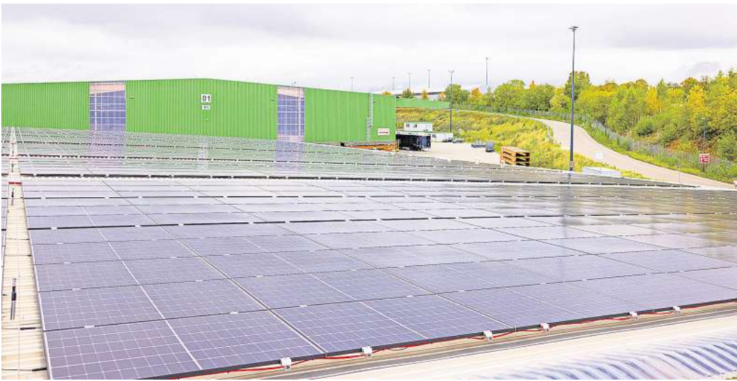
Auf den Dächern von großen Logistikhallen der Lübecker Hafen-Gesellschaft wurden Tausende Solarmodule verbaut.

Unternehmer, die sich für diesen Weg entscheiden, müssen sich aber durch einen Wust an Förderbedingungen, baurechtlichen Vorschriften und juristischen Feinheiten wühlen. Die Handwerks- und die Industrie- und Handelskammer bieten ihre Hilfe an. Studierende der Technischen Hochschule unterstützen