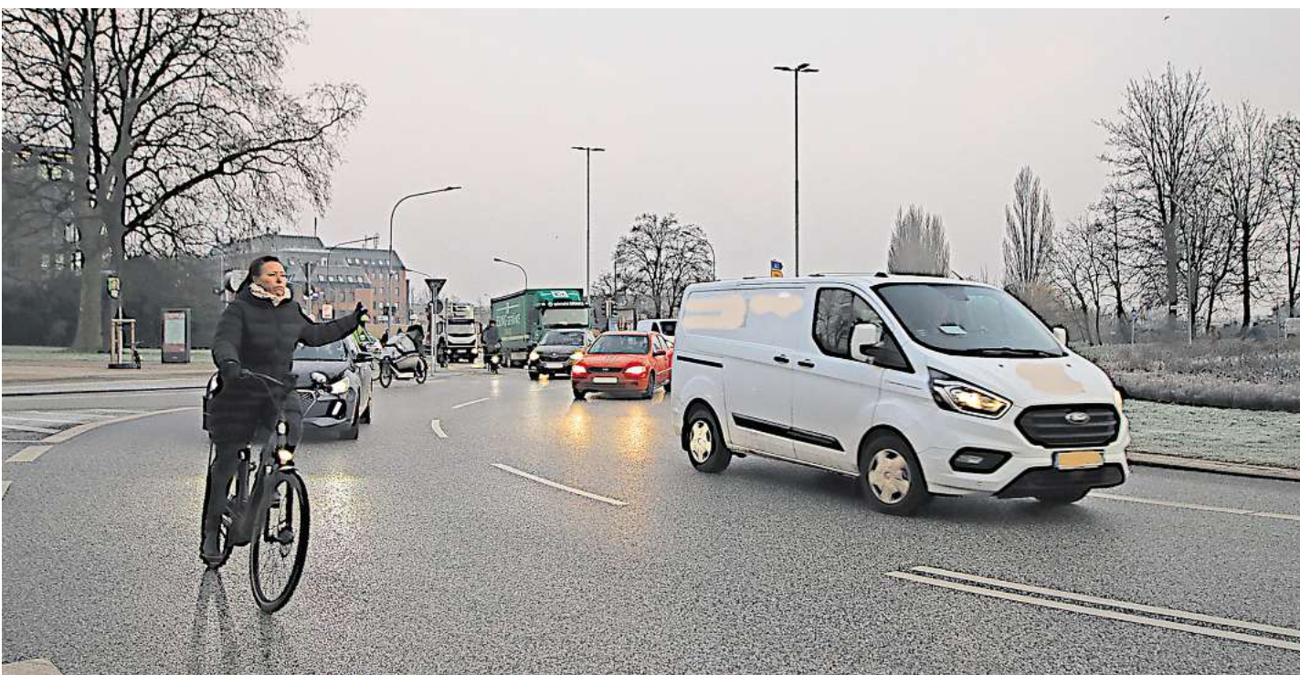
Auf dem Lindenteller in Lübeck müssen Verkehrsteilnehmende besonders aufeinander achten, damit kein Unfall passiert