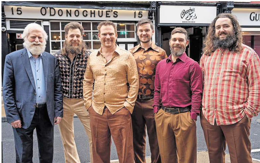
„The Dubliners Encore“ kommen nach Lübeck.

Tickets sind an der Museumskasse oder online erhältlich.