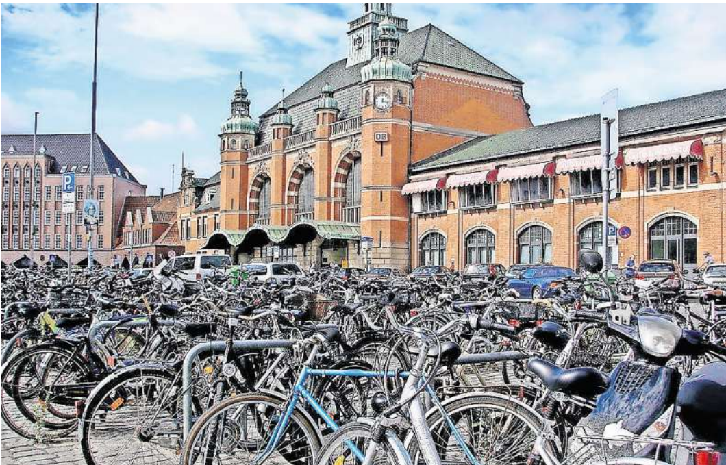
Viele Fahrräder stehen vor dem Lübecker Bahnhof. Wenn sie dort länger stehen und keinen Besitzer mehr haben, können sie im Fundbüro landen. Jetzt werden einige Räder online vom Zoll versteigert.

Mehr als 60 Fahrräder aus Lübeck werden seit dem 28. Januar zur Abholung angeboten. Das Startgebot liegt in den meisten Fällen bei 15 Euro. Bei einigen Auktionen sind sogar gleich mehrere Räder im Angebot.