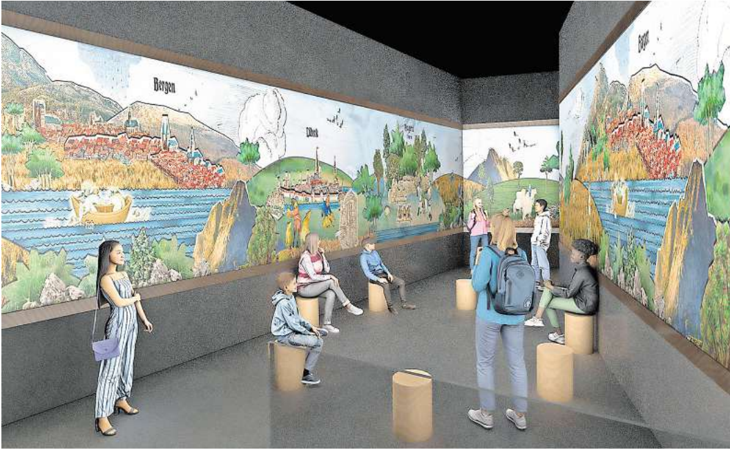
So soll der letzte Raum des Hansemuseums aussehen, wenn dort die immersive Videoprojektion über das Nachleben der Hanse läuft (digitale Simulation).

LÜBECK. Das Europäische Hansmuseum (EHM) hat auf seiner Jahrespressekonferenz das Programm und die Höhepunkte für 2025 vorgestellt. Das neue Jahr steht ganz im Zeichen des zehnjährigen Jubiläums, das unter dem Gedanken „Europa – Hanse – Lübeck“ zum Feiern einlädt. Im Rahmen der 2022 begonnenen Weiterentwicklung der Dauerausstellung steht ein weiterer Meilenstein an: die Fertigstellung des „Epilogs“ – des letzten Raumes der Ausstellung. Mit rund 98.000 Besuchern 2024 blickt das EHM auf ein weiteres erfolgreiches Jahr zurück. Zudem tritt das Citizen Science-Projekt der Forschungsstelle für die Geschichte der Hanse und des Ostseeraumes (FGHO) in eine neue Phase. 2025 feiert das Europäische Hansmuseum sein zehnjähriges Bestehen unter dem Motto „Europa – Hanse – Lübeck“. Ein Jahr voller abwechslungsreicher Formate lädt die Gäste dazu ein, die Geschichte der Hanse und ihre Bedeutung für Europa auf neue und spannende Weise zu entdecken. Seit der feierlichen Eröffnung im Jahr 2015 durch Bundeskanzlerin Angela Merkel hat das EHM zahlreiche Meilensteine erreicht. Als meistbesuchtes Museum in Lübeck trägt es zur Attraktivität der Stadt als Tourismusdestination bei und stärkt