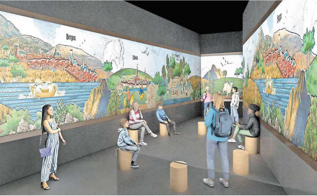
So soll der letzte Raum des Hansemuseums aussehen, wenn dort die immersive Videoprojektion über das Nachleben der Hanse läuft (digitale Simulation).

2025 feiert das Europäische Hansmuseum sein zehnjähriges Bestehen unter dem Motto „Europa – Hanse – Lübeck“. Ein Jahr voller abwechslungsreicher Formate lädt die Gäste dazu ein, die Geschichte der Hanse und ihre Bedeutung für Europa auf neue und spannende Weise zu entdecken. Seit der feierlichen Eröffnung im Jahr 2015 durch Bundeskanzlerin Angela Merkel hat das EHM zahlreiche Meilensteine erreicht. Als meistbesuchtes Museum in Lübeck trägt es zur Attraktivität der Stadt als Tourismusdestination bei und stärkt