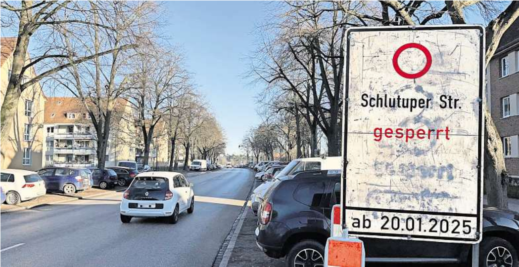
Seit dem Wochenende stehen im Stadtteil Schilder, die auf die Sperrung der Schlutuper Straße hinweisen. Ein Enddatum tragen sie bisher nicht.

Noch ist im Marliring zusätzlich eine kleine Baustelle. Sie sorgt für eine Verengung der Straße in Höhe der Knud-Rasmussen-Straße.