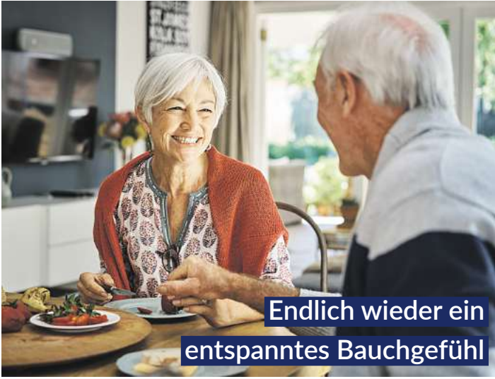
Endlich wieder ein entspanntes Bauchgefühl

Magen-Tropfen, sorgen sechs clever kombinierte natürliche Wirkstoffe für eine deutlich spürbare, schnelle „Erste Magen- und Verdauungshilfe“. Bitterstoffe aus Wermut-, Benediktenkraut und Angelikawurzel steigern rasch die Speichelproduktion und stoßen im Magen-Darm-Trakt die Produktion von Gallensaft und Magensäure an. 1,2 Dank Gänsefingerkraut, Süßholzwurzel sowie Kamillenblüten entspannen Magen und Darm.