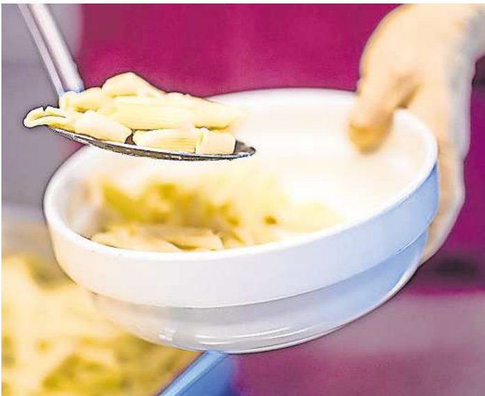
Essen in einer Lübecker Kita: Die Stadt bezuschusst die Mittagsverpflegung für alle Kinder in den Einrichtungen. Das kostet 3,46 Millionen Euro im Jahr.

Die Berliner empfehlen der Stadt, die Eltern ausschließlich bei den Betreuungskosten zu entlasten – durch eine maßvolle Absenkung der Beitragssätze unter den Beitragsdeckel des Landes. Die Berliner Gutachter sprechen sich zudem für eine gemeinsame Beitragsordnung für alle Kitas in städtischer und freier