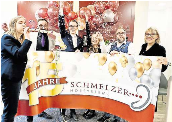
Das Team in Glinde feiert - hier begann die Erfolgsgeschichte des Familienunternehmens.

Ob in Tritttau, Travemünde, Lübeck oder Geesthacht – Schmelzer Hörsysteme ist die erste Adresse für Menschen, die auf