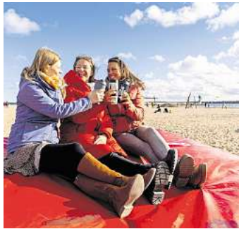
Der Wärmy ist noch bis Anfang Februar am Travemünder Strand zu finden.