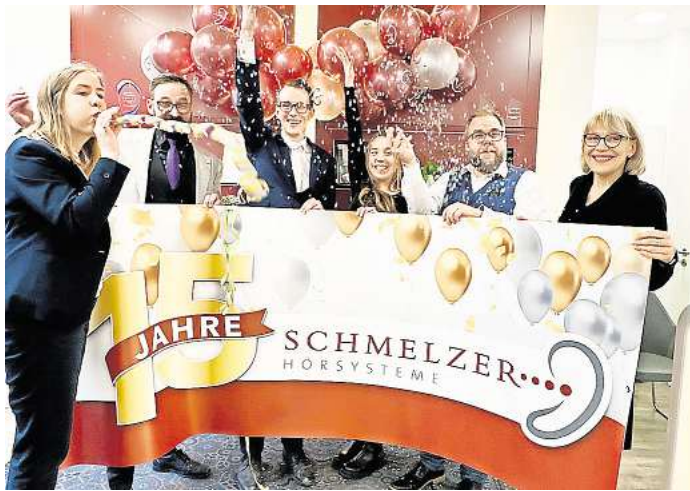
Das Team in Glinde feiert - hier begann die Erfolgsgeschichte des Familienunternehmens.

Ob in Tritttau, Travemünde, Lübeck oder Geesthacht – Schmelzer Hörsysteme ist die erste Adresse für Menschen, die auf