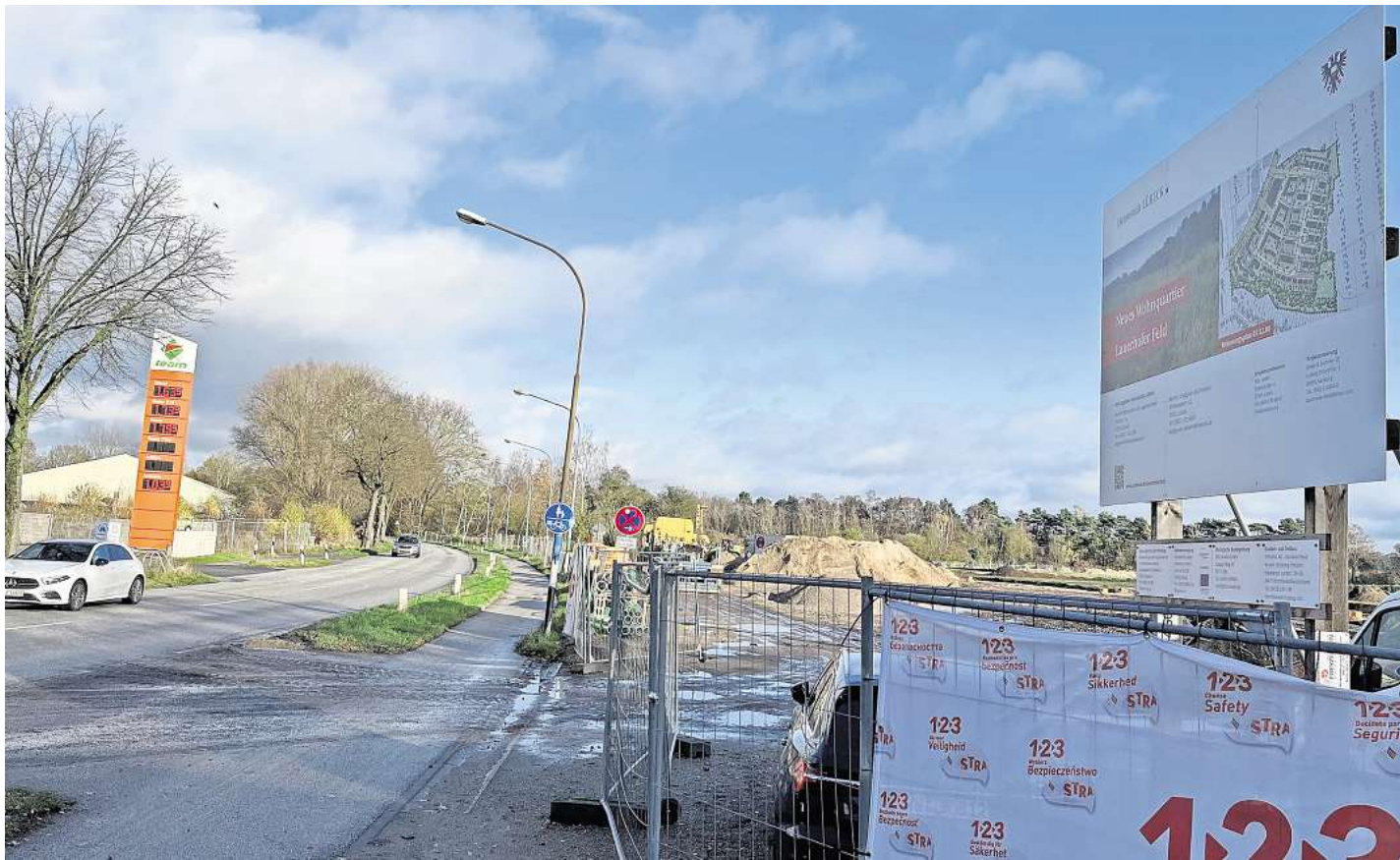
Ende 2024 starteten die Arbeiten auf dem Gelände des künftigen Neubaugebietes Lauerhofer Feld. Weil das ehemalige Kleingartengelände nicht an das lübsche Versorgungsnetz angeschlossen war, werden jetzt zunächst die Anschlüsse verlegt.

Allerdings ist die Schlutuper Straße eine Hauptverkehrsstraße im Stadtteil. Sie verbindet Marli mit Wesloe und Schlutup und letztlich mit Mecklenburg-Vorpommern. Es fließt jede Menge Verkehr. Pkw sollen laut Umleitungsempfehlung der Stadt vom 20. Januar an auf die Roonstraße, die Marlistraße und die Arnimstraße