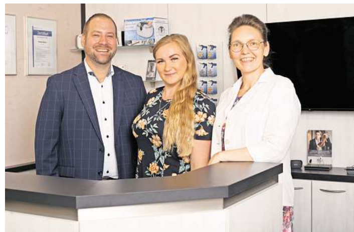
Erstklassigen Service und hohe Qualität bietet auch das Team von Hörgeräte Kersten in Stockelsdorf.

■ Hörgeräte Kersten Rathausmarkt 2b 23617 Stockelsdorf Telefon 0451 / 49 91 29 3 www.hoergeraete-kersten.de