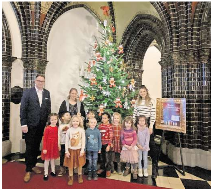
Kinder der Kita Kleine Strolche durften in diesem Jahr die große Tanne im Foyer des Lübecker Rathauses schmücken

baum im Rathaus von Kindern einer Kita schmücken zu lassen, entstand 2019, nachdem die Lichtkönigin Lucia ihr Kommen abgesagt hatte. Bürgermeister Jan Lindenau suchte nach einer Alternative. Damals führte er die neue Tradition ein. Seitdem wird immer in der Vorweihnachtszeit, pünktlich zum ersten Advent von Kindergartenkindern die große Tanne im Rathaus in einen bunten Weihnachtsbaum mit selbstgebasteltem Schmuck verwandelt. Den Anfang machte 2019 die Kita St. Aegidien, 2020 übernahm die Kita Brüder-Grimm-Ring die Aufgabe. 2021 folgte der Naturkindergarten des Land-