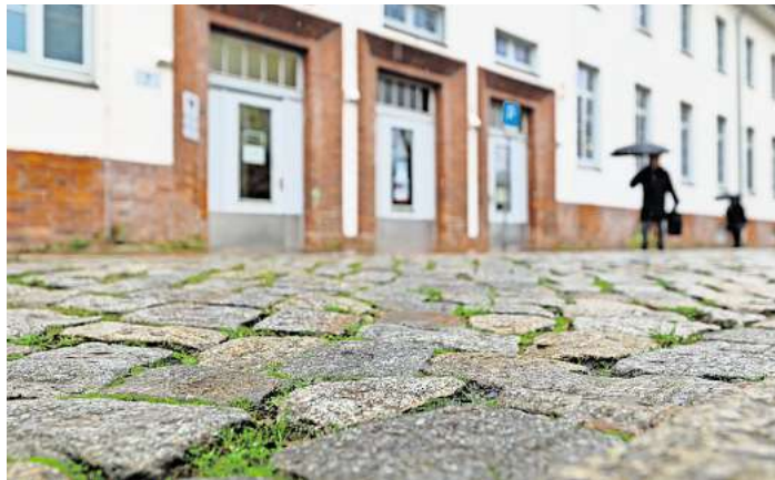
Am Meesenring soll der Übergang zum Bürgerservicebüro neu gepflastert werden.