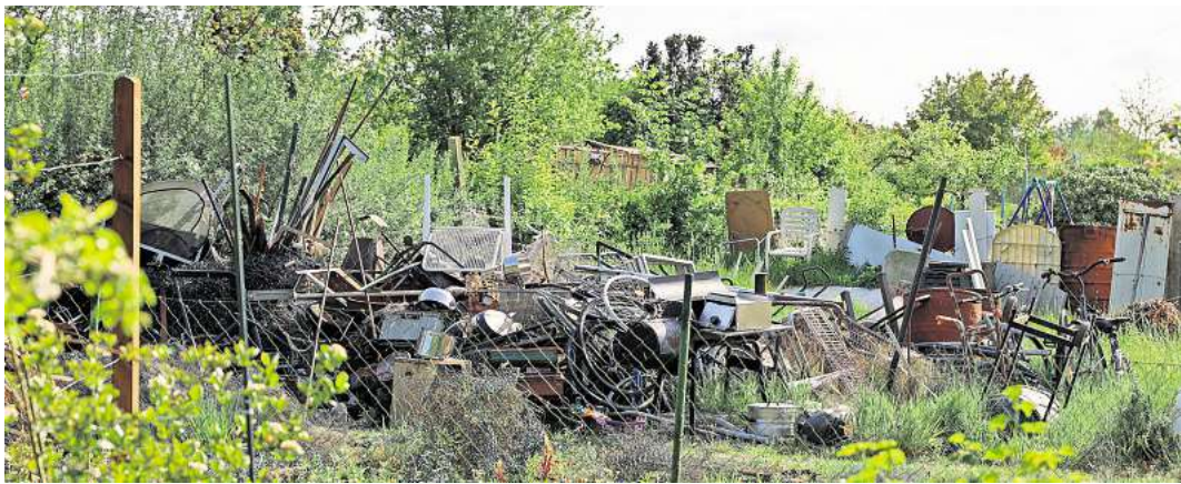
Auf dem Teil des Schrebergartenareals Buntekuh, auf dem die KWL ein Gewerbegebiet entwickeln will, entstehen immer wieder wilde Müllkippen.

Jetzt liegen die Ergebnisse der Kontrollen vor. Bei 150 Parzellen habe es Beanstandungen gegeben, berichtete Birgit Hartmann, Bereichsleiterin von Umwelt-