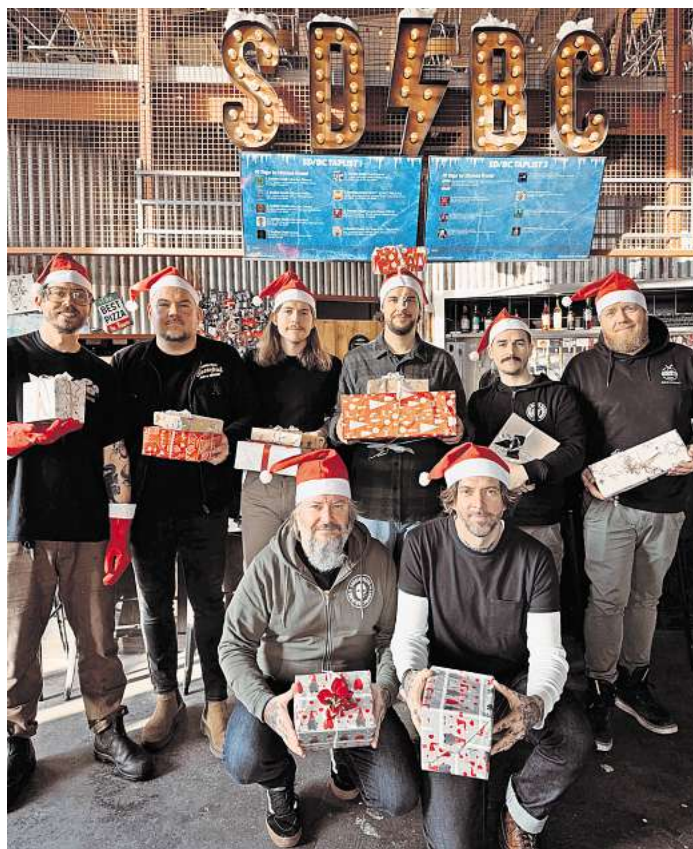
Die Crew der Sudden Death Brauerei initiiert wieder eine Aktion für die Obdachlosenhilfe Lübeck.

Sachspenden können bis spätestens Samstag, 14. Dezember, bei der Sudden Death Brauerei an der Einsiedelstraße 6 in Lübeck abgegeben werden. „Mit dieser Aktion möchten wir nicht nur helfen, sondern auch ein Zeichen setzen: Niemand sollte in unserer Gesellschaft übersehen werden.