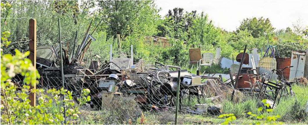
Auf dem Teil des Schrebergartenareals Buntekuh, auf dem die KWL ein Gewerbegebiet entwickeln will, entstehen immer wieder wilde Müllkippen.