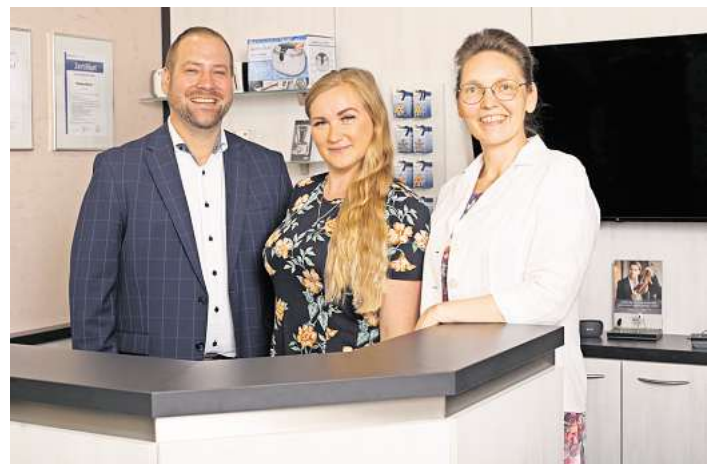
Erstklassigen Service und hohe Qualität bietet auch das Team von Hörgeräte Kersten in Stockelsdorf.

■ Hörgeräte Kersten Rathausmarkt 2b 23617 Stockelsdorf Telefon 0451 / 49 91 29 3 www.hoergeraete-kersten.de