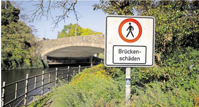
Die Unterquerungen der Lübecker Puppenbrücke bleiben gesperrt. Eine Mehrheit im Rathaus hat Gelder für die Planung von Geh- und Radwegen gestrichen.

CDU-Finanzpolitiker Bernhard Simon verweist auf „die unverhältnismäßig hohen Kosten“, und CDU-Baupolitiker Ulrich Brock hat Zweifel, dass neue Unterquerungen wirklich die Probleme auf dem Lindenteller lösen würden.