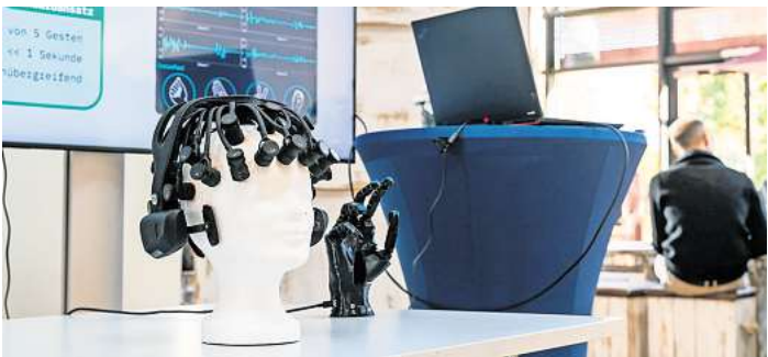
Im Labor des Deutschen Forschungszentrums für Künstliche Intelligenz (DFKI) auf dem Uni-Campus wird der Einsatz von KI im Gesundheitswesen erforscht.

Der Forschungsschwerpunkt liegt auf dem Einsatz von Künstlicher Intelligenz im Gesundheitswesen. Die Arbeiten umfassen unter anderem die KI-gestützte