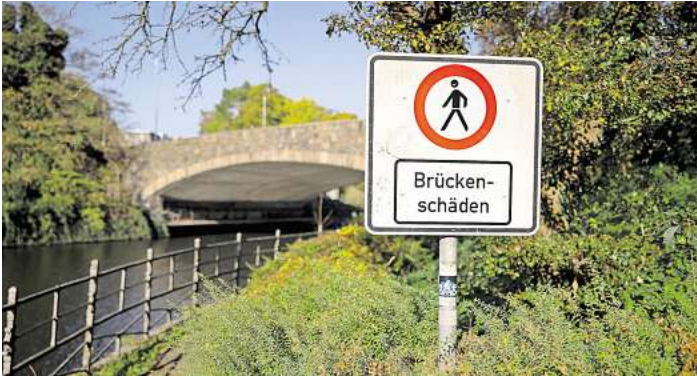
Die Unterquerungen der Lübecker Puppenbrücke bleiben gesperrt. Eine Mehrheit im Rathaus hat Gelder für die Planung von Geh- und Radwegen gestrichen.

CDU-Finanzpolitiker Bernhard Simon verweist auf „die unverhältnismäßig hohen Kosten“, und CDU-Baupolitiker Ulrich Brock hat Zweifel, dass neue Unterquerungen wirklich die Probleme auf dem Lindenteller lösen würden.