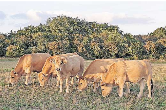
Die Rinderherde verbringt den Sommer auf Moorwiesen.

Mit ihrem monatlichen Geldbetrag kommen die Teilhaber für alle Kosten der Tierhaltung auf. Im kommenden Jahr stehen elf Tiere zur Schlachtung an. Die Fleischanteile werden portioniert, vakuumiert und etikettiert.