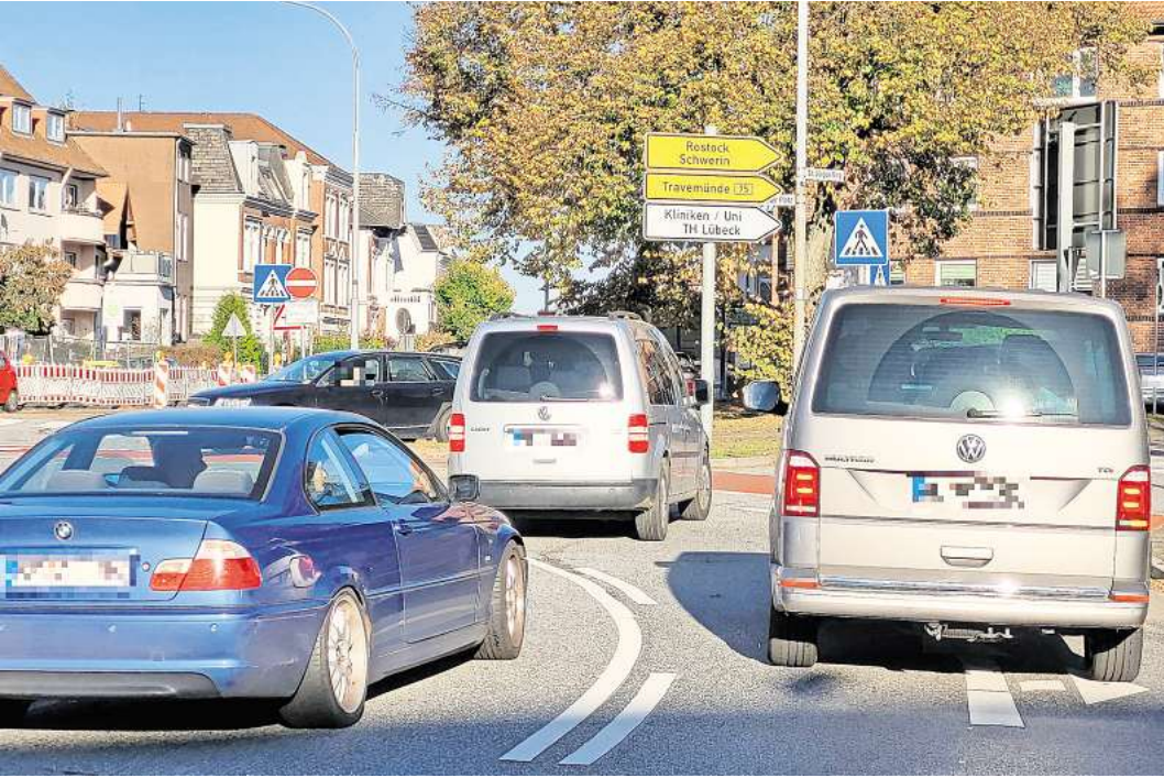
Die neue Regelung am Berliner Platz scheint vielen Autofahrern noch nicht geläufig zu sein.

Der Lübecker Stadtverwaltung liegen zu Linien-Verstößen an