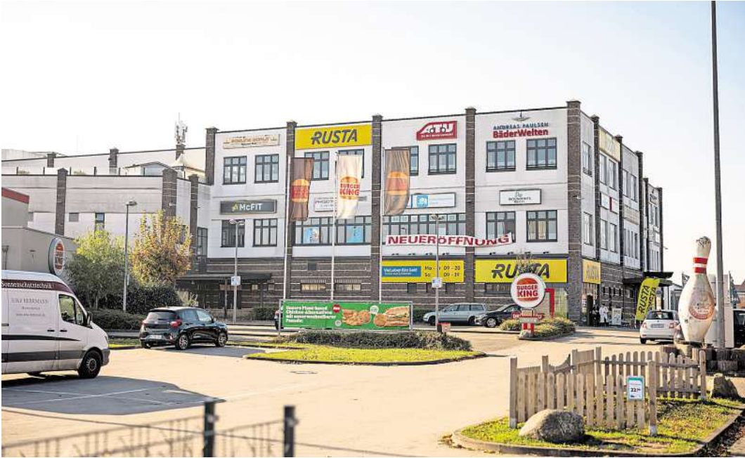
Im A 1 Center an der Lohmühle sind keine Lebensmittelmärkte möglich. Die Stadt will das nicht, ein Gericht gab ihr Recht.

Statt auf dem Grundstück des A 1 Centers hat die Stadt auf der