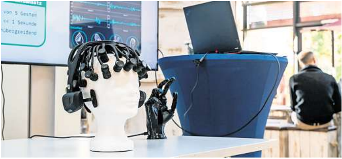
Im Labor des Deutschen Forschungszentrums für Künstliche Intelligenz (DFKI) auf dem Uni-Campus wird der Einsatz von KI im Gesundheitswesen erforscht.

Der Forschungsschwerpunkt liegt auf dem Einsatz von Künstlicher Intelligenz im Gesundheitswesen. Die Arbeiten umfassen unter anderem die KI-gestützte