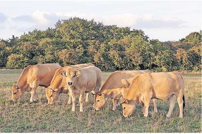
Die Rinderherde verbringt den Sommer auf Moorwiesen.