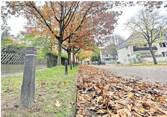
In der Hohenstauftenstraße hat die Lübecker Stadtverwaltung rund 25 neue Poller aufgestellt.

Dort wachsen Roteichen auf einem Grünstreifen zwischen Fahrbahn und Gehweg. „Die Eichen sind gut 60 Jahre alt und haben sich bisher gut entwickelt“, sagt die Stadt. „Durch unnötiges und unrechtmäßiges Parken auf den Baumwurzeln wurde der Boden jedoch stark verdichtet und hat seine Wasseraufnahmefähigkeit dadurch verloren.“