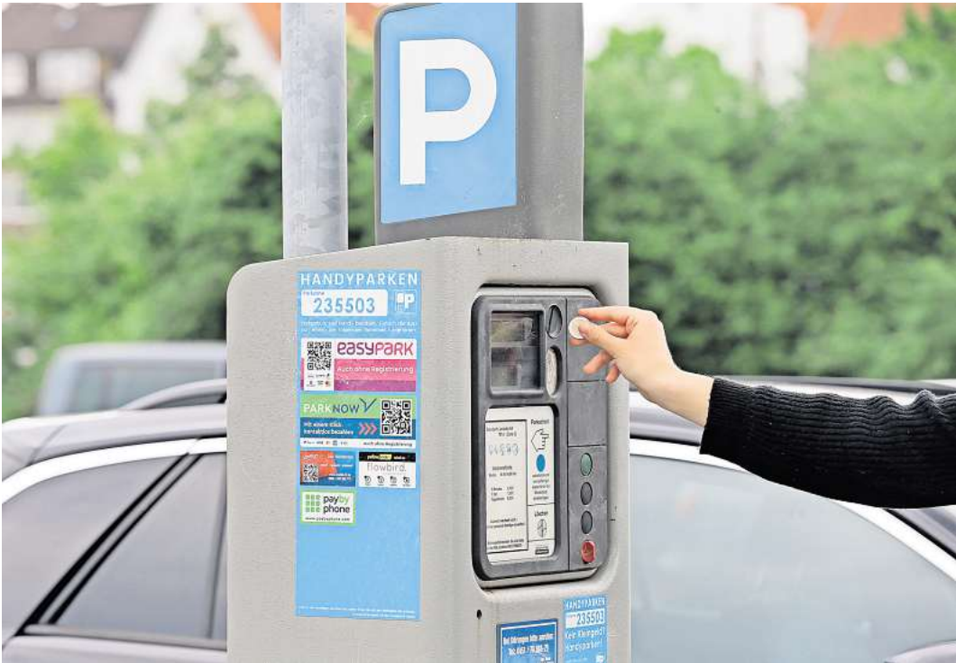
Die Parkgebühren in Lübeck könnten bald steigen.

Parallel beantragten Linke & GAL abermals eine „zeitgemäße