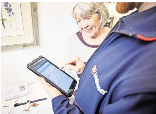
Angst zu stolpern? Der Malteser Hausnotruf gibt ein Gefühl von Sicherheit in den eigenen vier Wänden.