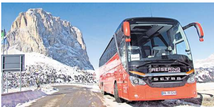
Wer Urlaub mit dem Reisering macht, ist in knallroten Komfortbussen unterwegs.

LÜBECK/HAMBURG. Unglaublich – aber wahr, es sind nur noch gut zehn Wochen, ehe Heiligabend und damit das Fest der Liebe und der Familie vor der Tür steht. Was aber, wenn man die Festtage nicht unbedingt zu Hause verbringen möchte? Ein Erlebnis anderswo mit gleichgesinnten netten Menschen sucht? Und vielleicht auch ein bisschen der Frage aus dem Weg geht, wer denn nun für das Weihnachtessen, den Tannen-