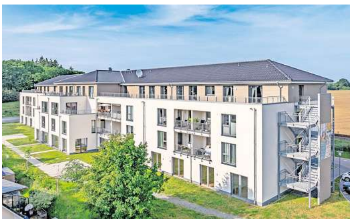
Der Wohnpark Techau mit Blick auf die Tagespflege im 3. OG.

Darüber hinaus werden regelmäßig gemeinsame Ausflüge sowie jahreszeitlich inspirierte Aktionen organisiert. Die große Dachterrasse bietet nicht nur viel Platz für Feste und Feiern aller Art, sondern dient auch als „ge-