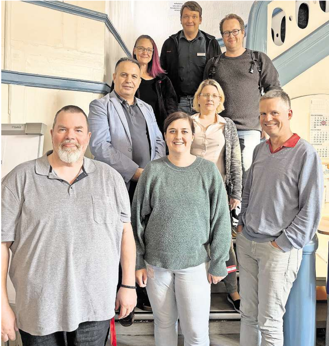
Einige Vertreter:innen des Beirats zu Besuch in der Beratungsstelle

„In die Beratungsstelle kommen Männer in unterschiedlichen Problemlagen. Die Mitarbeitenden vor Ort beraten die Betroffenen professionell und vertraulich. Die Kollegen vom Jobcenter helfen beispielsweise dabei, Bürgergeld zu beantragen, kümmern sich um die Abrechnung der Notunterkünfte und unterstützen bei der Suche nach Arbeit. Auch bei Fragen zur Wohnungssuche stehen sie zur Seite. In den Räumlichkeiten kann sogar geduscht oder Wäsche gewaschen werden“, er-