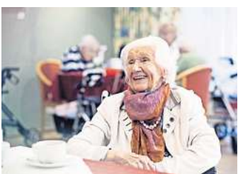
Gut versorgt im Alter und individuell leben – das ist das Motto des Quellenhofs.

VIEL SPIELRAUM FÜR INDIVIDUALITÄT Eine große Besonderheit im Seniorenwohnsitz sind die bis zum 30 qm großen Zimmer für die Bewohnerinnen und Bewohner. Aufgrund der Größe ist viel Spielraum für individuelle Wohnraumgestaltung vorhanden und eigene Möbel können natürlich auch mitgebracht werden. „Um so schöne und große Zimmer anbieten zu können, hat unser Architekt die Balkone mit zu den Zimmern hinzugezogen. Eine tolle Idee, die viel Platzangebot geschaffen hat und die schöne und große Fensterfront, teils mit Gartenblick, hat den Balkon-Charakter erhalten“, ergänzt die Einrichtungsleiterin. „Die neuen und modernisierten Bäder schaffen zudem Raum für die Bewohnerinnen und unsere Mitarbeitenden