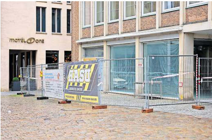
Statt regen Cafébetriebes eine abgesperrte Baustelle: Der Umbau des einstigen Café Maret ist aufwendiger als gedacht.

Zum Hansekulturfestival (HKF) im Juni hatten die neuen Betreiber von einem provisorischen Tresen aus Getränke und kleine Speisen verkauft. Das ließ hoffen, dass die Sanierungsarbeiten vorangingen und bald mit einer Eröffnung zu rechnen sei.