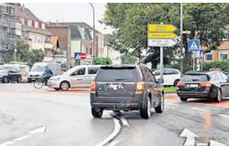
Am Berliner Platz ignorieren viele Autofahrer die durchgezogene Linie.

Die Stadtverwaltung habe wegen Unfällen reagieren müssen, sagte Dirk Dreilich, zuständig für die Straßenplanung bei der Hansestadt Lübeck, im Bauausschuss. An den beiden Kreisverkehren