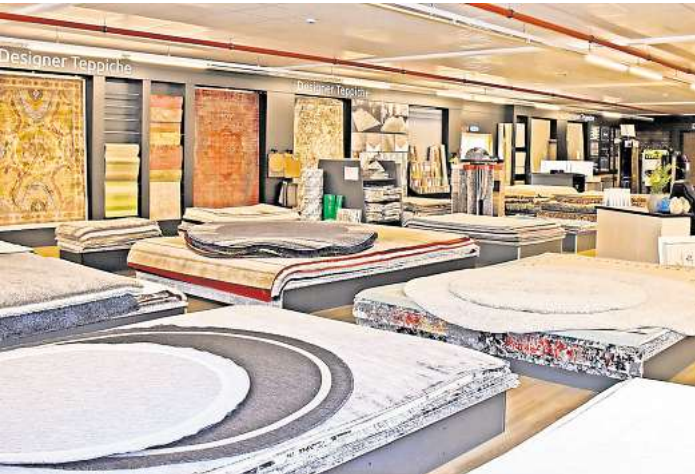
Knutzen Home bietet die größte Teppichabteilung Ostholsteins.

OSTHOLSTEIN. Vor 50 Jahren erfüllten sich zwei junge Männer einen Traum: Sie eröffneten ihr erstes eigenes Geschäft. Mit Knutzen Home läuteten sie eine Ära des Wohnens und Wohlfühlens ein, die von Qualität, Design und Kundennähe geprägt ist. Nun feiert der Marktführer in den Segmenten Bodenbeläge, Teppiche und Fensterdekoration sein Jubiläum und lädt Kundinnen und Kunden mit Rabattaktionen und historischen Rückblicken zum Feiern ein. Bis Ende Oktober lohnt sich ein Besuch in den Knutzen-Filialen: Denn wer sich neu einrichten möchte, erhält dort Inspiration und tolle Angebote.