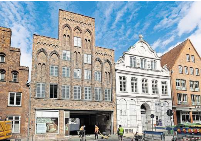
Der Umbau des Buddenbrookhauses in der Mengstraße kann jetzt weitergehen.