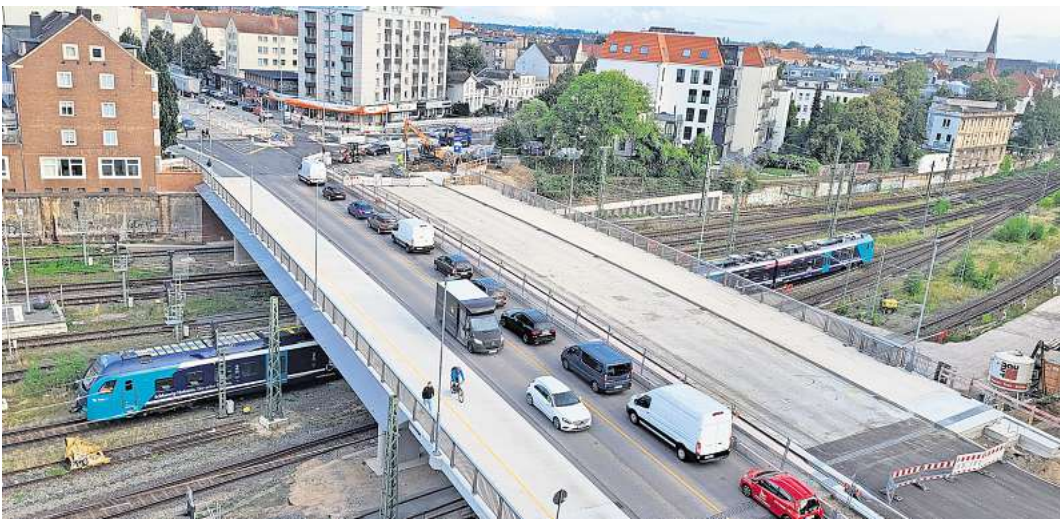
Lübecks neue Bahnhofsbrücke: Am Sonntag gibt es dort eine Info-Veranstaltung..

möchten dieses Ereignis zum Anlass nehmen, gemeinsam mit den Lübeckerinnen und Lübeckern auf die Bauzeit zurückzublicken und uns besonders für die Geduld während der Verkehrseinschränkungen zu bedanken.“ Höhepunkt der Veranstaltung ist die Preisverleihung des Papierbrückenwettbewerbs, der anlässlich der Fertigstellung der neuen Bahnhofsbrücke ins Leben gerufen wurde. Insgesamt wurden 61 Papierbrücken eingereicht, die bei der Veranstaltung einem Belastungstest unterzogen und die Sieger gekürt werden. Als besonderes Dankeschön erhalten alle Teilnehmenden des Wettbewerbs, deren Brücke die Wettbewerbsvoraussetzungen erfüllen, die Menge an Marzipan, die der Tragkraft ihrer Papierbrücke entspricht.