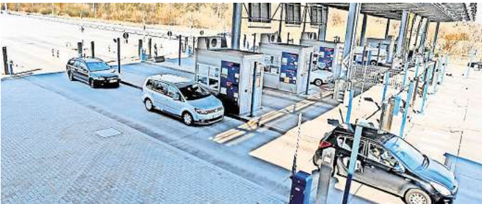
Die Mautstation wird auch in Zukunft benötigt werden.

hatte die Verwaltung in ihrem Beschlussvorschlag gewarnt. Der Gemeinnützige Verein hatte vor der Sitzung der Bürgerschaft öffentlich befürchtet, dass sich die Politiker „weich klopfen“ lassen und zustimmen. Die Kücknitzer wollten, dass die Stadt sich auf eine Klage durch den Herrentunnel-Betreiber einlässt. Hintergrund: Der Konzessionsvertrag sieht für den Fall, dass die Bürgerschaft die Verlängerung bis 2045 verweigert, zunächst ein Schlichtungsverfahren und danach ein Gerichtsverfahren vor. Das aber würde laut Verwaltung rund 1,9