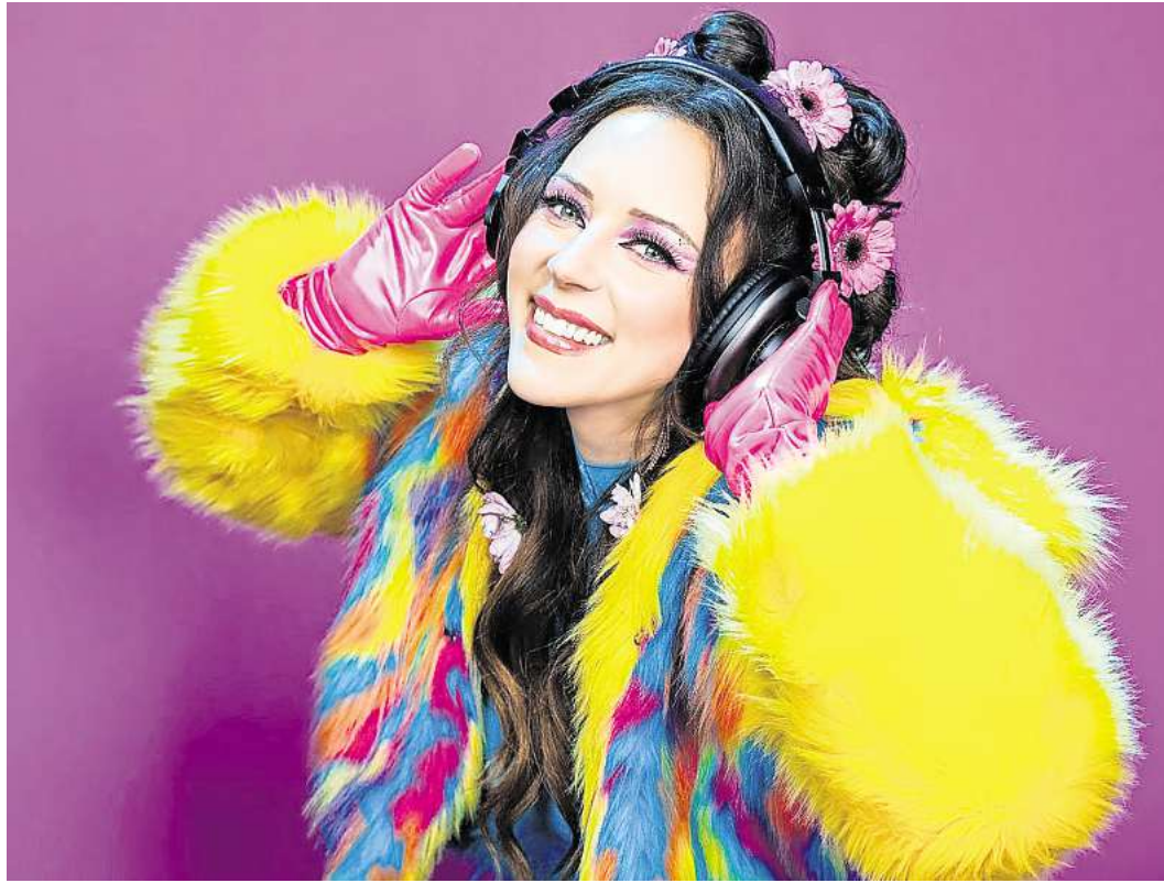
„Herz an Herz“: Blümchen ist eine wahre 90er-Ikone.

Die Veranstaltung ist Teil der bis zum 18. Oktober in Lübeck stattfindenden Hospiz- und Palliativwoche, die seit 2023 als „Festival der Endlichkeit“ gefeiert wird. Unter dem Motto „Moin Tod!“ soll gemeinsam das Leben gefeiert und über den Tod reflektiert werden. Das Programm ist unter www.festivalderendlichkeit.de abrufbar.