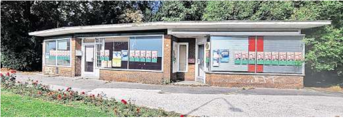
Das kleine Häuschen am Mühlentorteller steht leer.

brücke, während der das Gebäude, das im rückwärtigen Bereich auch über Sanitäranlagen verfügt, durch die Hansestadt Lübeck genutzt werden wird.“ Die Sanierung der Brücke wird mindestens zwei Jahre dauern. Was danach mit dem Häuschen passieren wird, ist derzeit noch unklar.