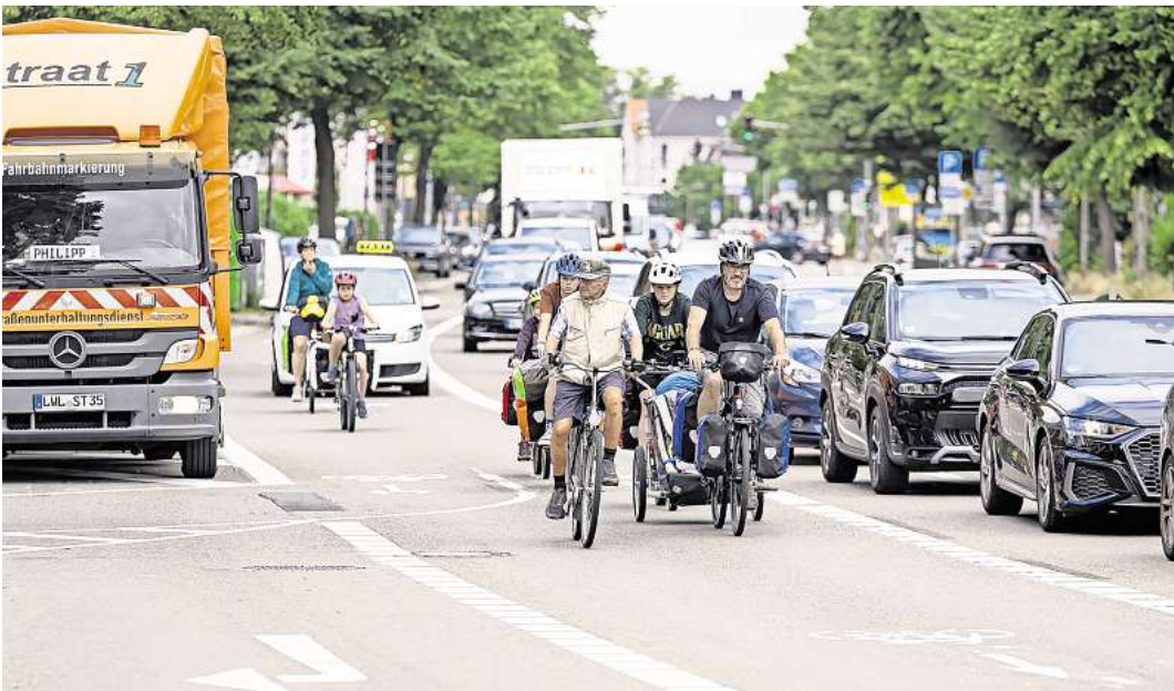
Im Juli 2022 startete der Verkehrsversuch in der Fackenburger und der Krempelsdorfer Allee. Autos hatten weniger Platz, Radfahrer dagegen mehr.

abgewickelt werden und der frei werdende Verkehrsraum zu Gunsten des Umweltverbundes genutzt werden kann“, lautet das Fazit der Verwaltung. Angesichts der nur in geringem Maße eingetretenen positiven Auswirkungen sollten gravierende Umverteilungen des Straßenraumes an Hauptverkehrsachsen in Lübeck nicht ohne wichtigen Anlass erfolgen, heißt es weiter. Es bestehe „derzeit zunächst kein Anlass, die Fackenburger Allee entsprechend des Verkehrsversuchs umzugestalten“, sagt die Verwaltung. Für die Ausweisung von Radschnellwegen oder Busspuren will die Verwaltung allerdings Platz auf Hauptstraßen schaffen. Das große Umsteigen vom Auto auf Bus oder Fahrrad fand nicht statt. „Hat man sich einmal für ein bestimmtes Verkehrsmittel und einen bestimmten Weg zur Arbeit entschieden, hält man recht lange daran fest“, erklärt sich die Verwaltung das Verhalten der Menschen, „daher war ein Stück weit zu erwarten, dass auf der Fackenburger Allee nicht