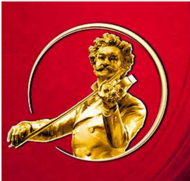
Johann Strauss Revue Kolosseum, Lübeck