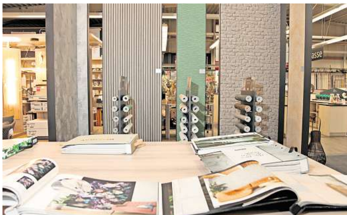
Muster über Muster – ob als Rolle, Schauwand oder Ansichtsbuch, bei Knutzen Home findet sich eine unfassbar große Auswahl an Tapeten.

Knutzen Home Industriestraße 12a, 23701 Eutin www.knutzen-home.de