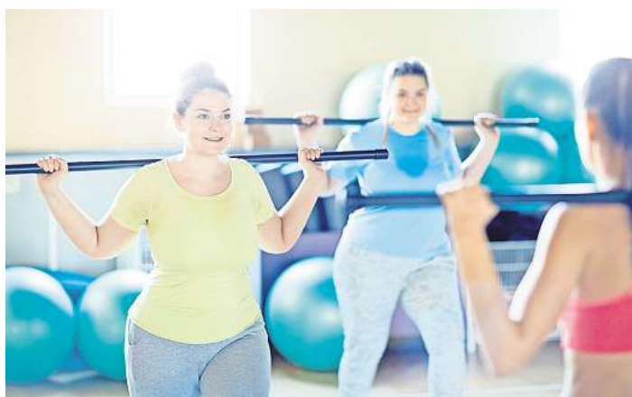
Demnächst starten in Lübeck Kurse mit freien Plätzen.

Im Kurs „Functional Training“ sorgt ein kluges Muskeltraining für Stabilität im Körper. Ganz dem aktuellen Trend folgend, ler-