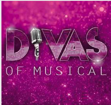
Divas of Musical Kolosseum, Lübeck