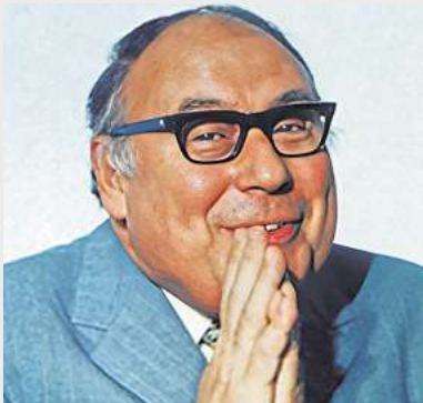
Heinz Erhardt Revue MuK, Lübeck