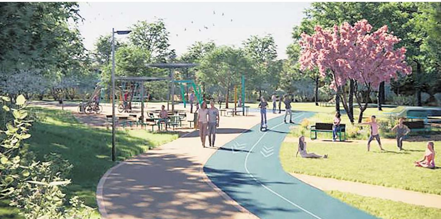
So stellen sich die Planer den Quartierspark in vor. Verwirklicht wird er erstmal nicht.

„Die Schülerinnen und Schüler der Grund- und Gemeinschaftsschule Tremser Teich hätten die Anlage mitnutzen können, was den Schulsport erheblich gestärkt hätte“, sagt der SPD-Politiker, der im Hauptberuf Schulleiter von Tremser Teich ist. „Die Kinder aus dem Quartier haben ihre Ideen und Wünsche einge-