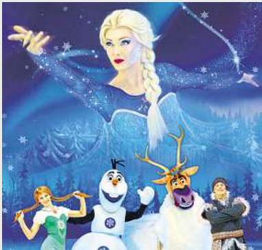
Eiskönigin 1 & 2 MuK, Lübeck