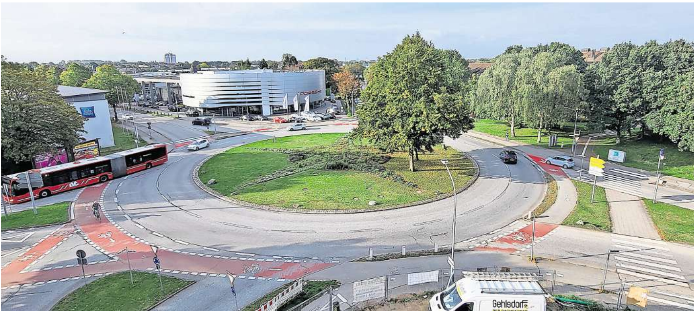
Einer der Kreisverkehre, die sicherer werden sollen: Neben dem Lindenplatz wird auch hier am Berliner Platz die Verkehrsführung geändert.

geleitet von der Diplompädagogin Svenja Krumpeter-Büttner und findet im Kita-Gebäude an der Maria-Goeppert-Straße 12 statt. Anmeldung bis 9. Oktober unter faz-drachennest@awo-sh.de oder der Telefonnummer 0451/58249422.