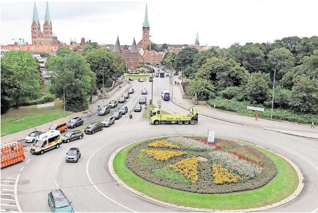
So sieht das blühende Peace-Zeichen auf dem Lindenteller von oben aus.

Das Team der Diakonie Nord Nord Ost ist wieder mit Freude und Einsatz dabei. Das Wetter spielte den Gärtner*innen bisher in die Karten. „Wir mussten die Blumen und Pflanzen nicht so viel gießen, letztlich hat es regelmäßig geregnet – genau passend für