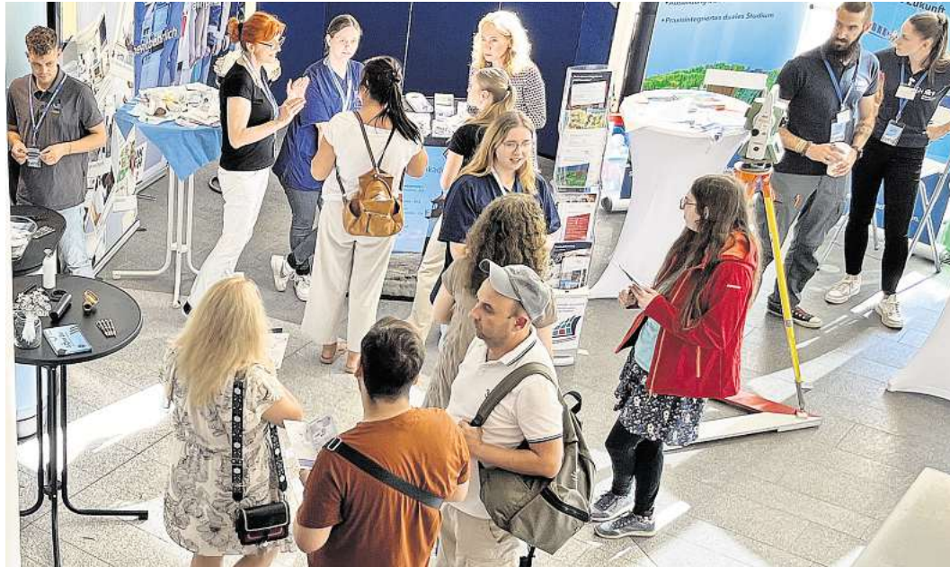
Bei der LN-Azubimeile kommen Bewerber und Arbeitgeber miteinander ins Gespräch.

INNENSTADT. Am 12. September um 19.30 Uhr lädt das Europäische Hansemuseum zu einem musikalischen Erlebnis mit dem finnischen Folk-Duo „Hurja Halla“ ins Burgkloster ein. Der Eintritt ist frei, jedoch wird die Buchung eines kostenfreien Tickets über hansemuseum.eu empfohlen.