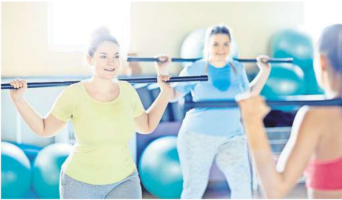
Demnächst starten Kurse mit freien Plätzen.